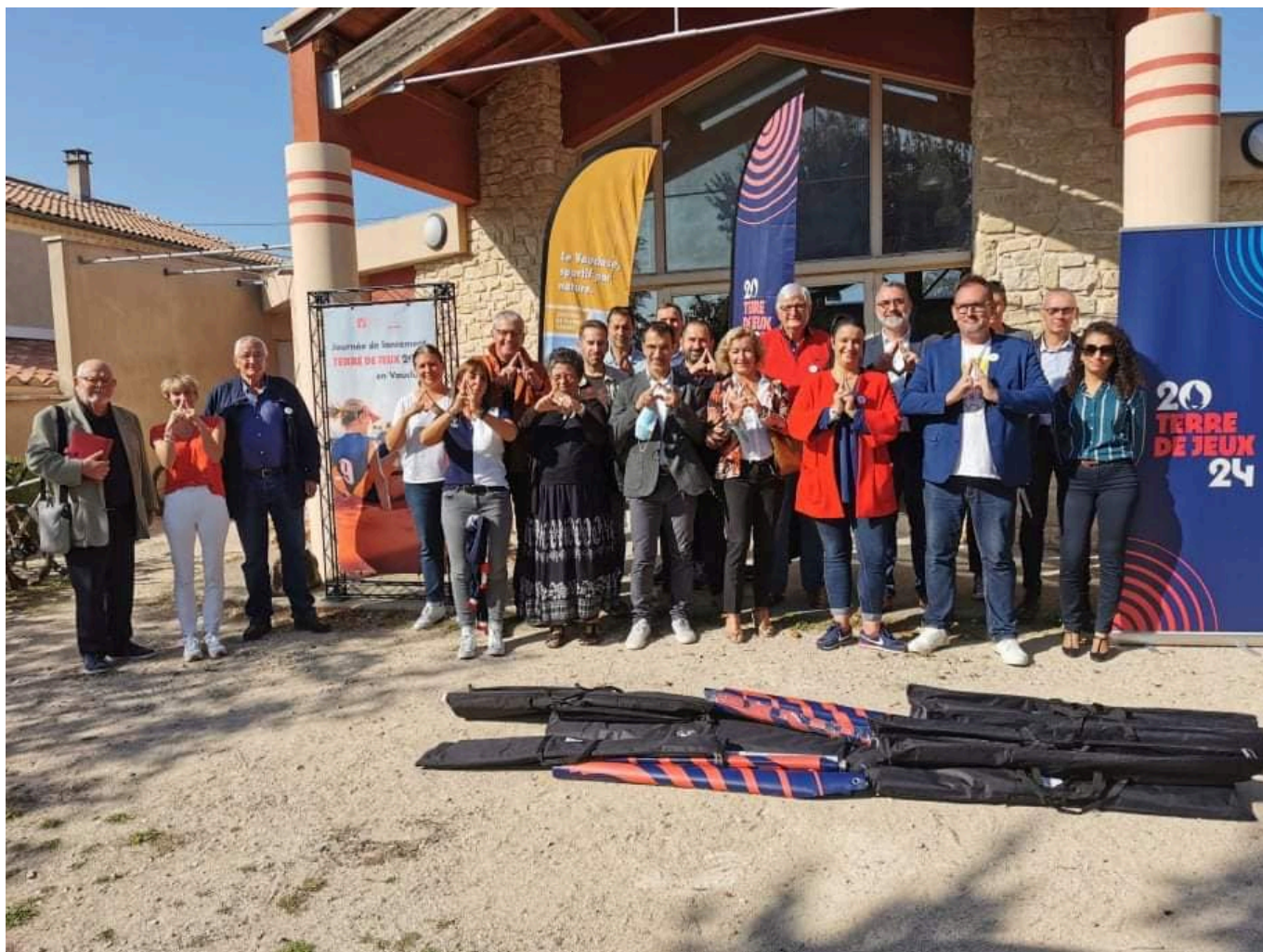
Rassemblement des 25 communes Vauclusiennes labellisées Terre de Jeux 2024 à Rasteau.