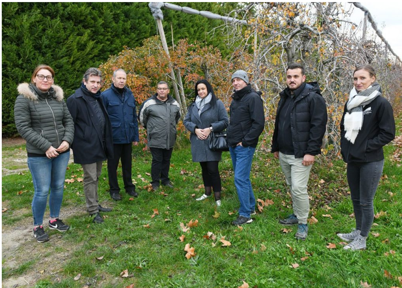
Visite de la société civile d'exploitation agricole « La Perrine » à Sorgues.