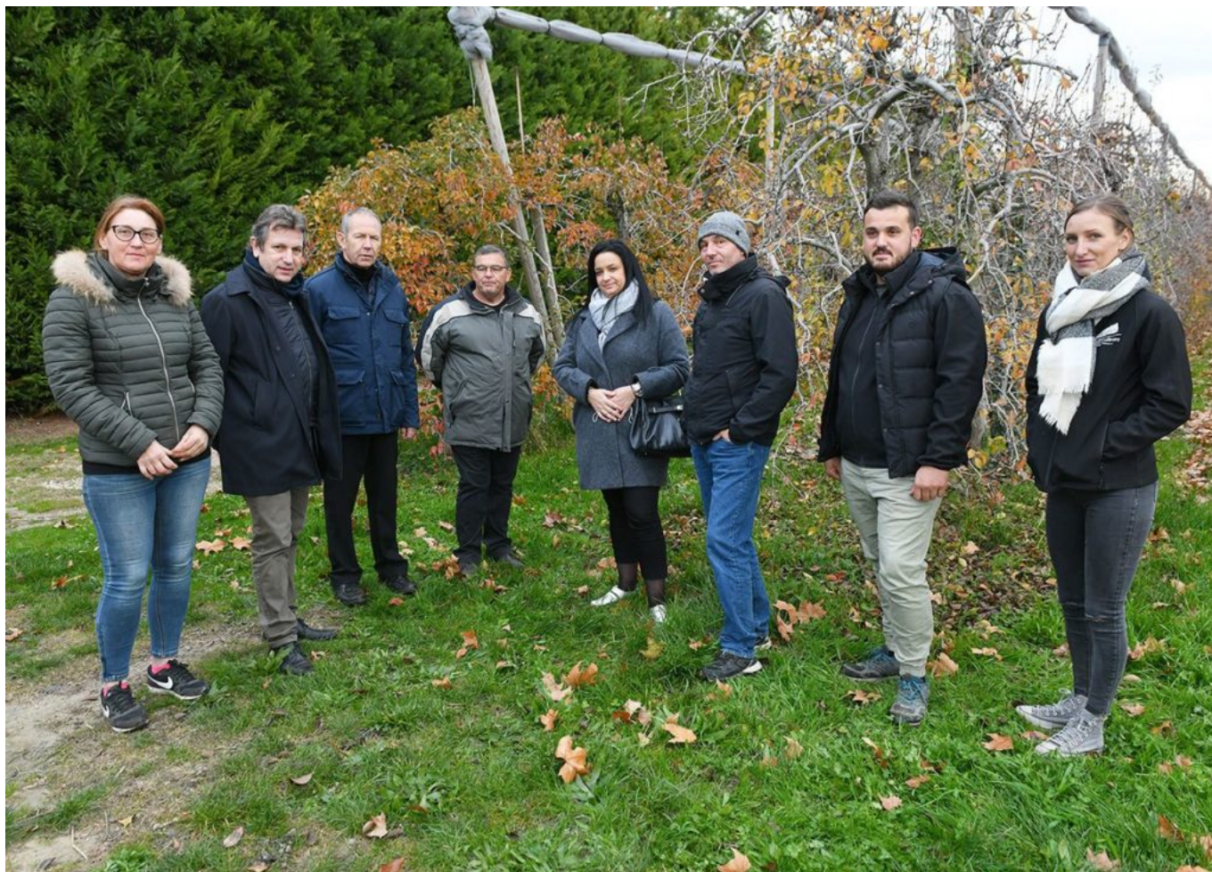
Visite de la société civile d'exploitation agricole « La Perrine » à Sorgues.