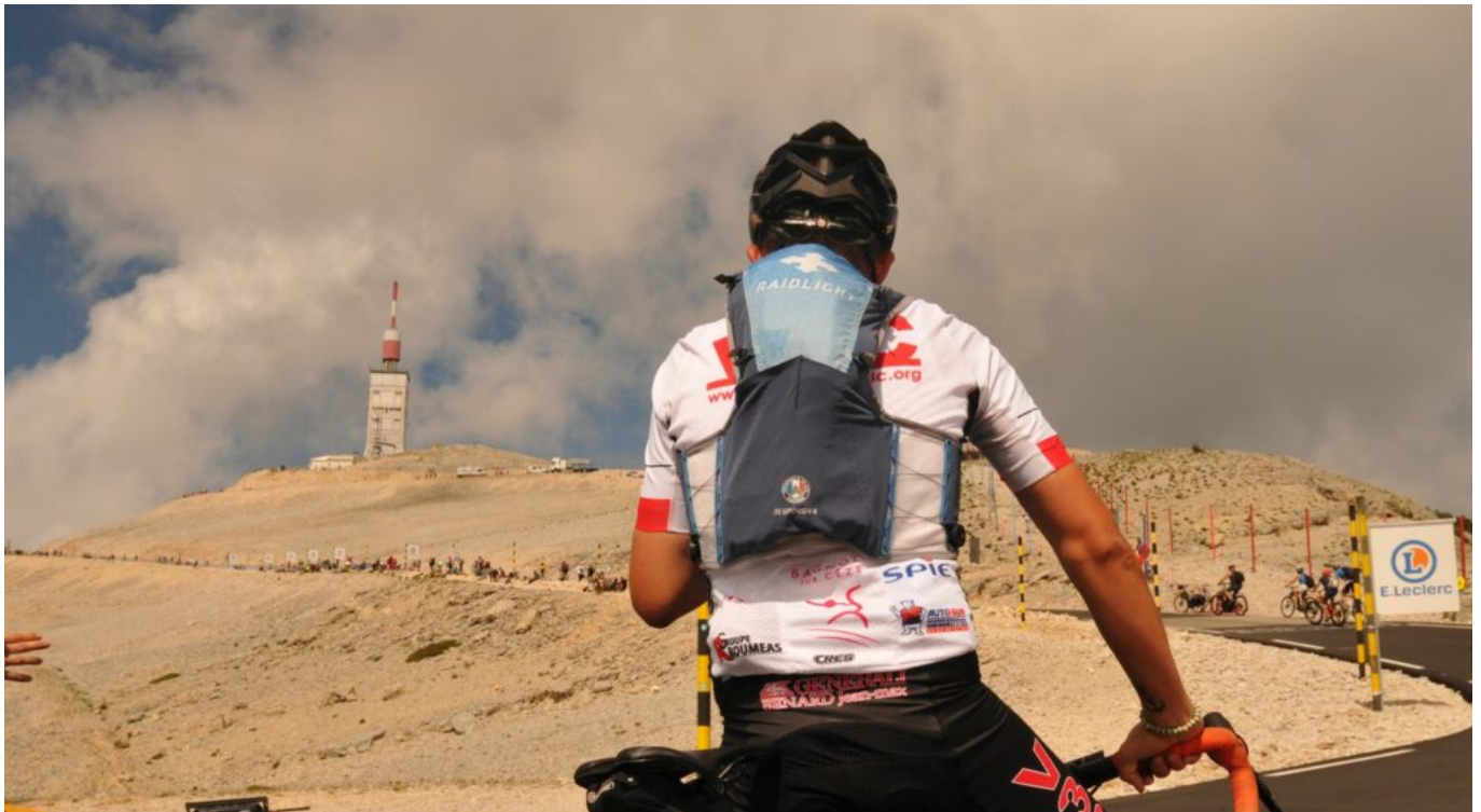
Cyclotouriste avant l'étape de 2021.