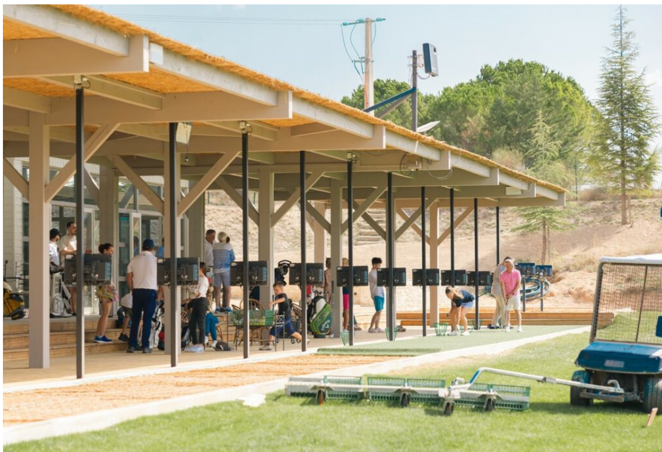
Le practice.

« Nous accompagnons tous les niveaux pendant 1h30 de cours les mercredis et les samedis, hors vacances scolaires, expliquent les responsables du golf des Ocres. Passage des drapeaux, compétition de classement trimestrielle, apprentissage avec les technologies Trackman et Lemerle, prêt du matériel : les golfeurs en herbe progressent et s'épanouissent dans un cadre verdoyant. »