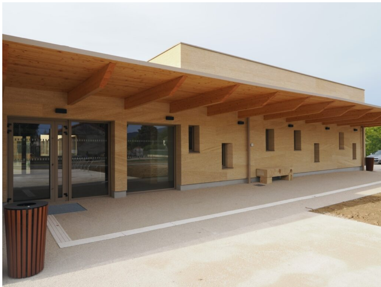
La salle Sandrine Martinet

La salle Sandrine Martinet sera inaugurée le samedi 12 octobre à 18h en présence de la championne paralympique.