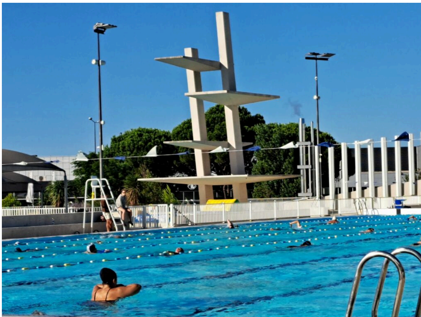
Le plongeur iconique du Stade Nautique d'Avignon

Et comme l'avait dit Bertrand Gaume, le précédent préfet de Vaucluse, en décembre 2019, quand il avait inauguré le Stade Nautique rénové aux côtés de Cécile Helle : « Apprendre à nager à tous les élèves est une priorité nationale inscrite dans le socle commun de connaissances et de compétences ».