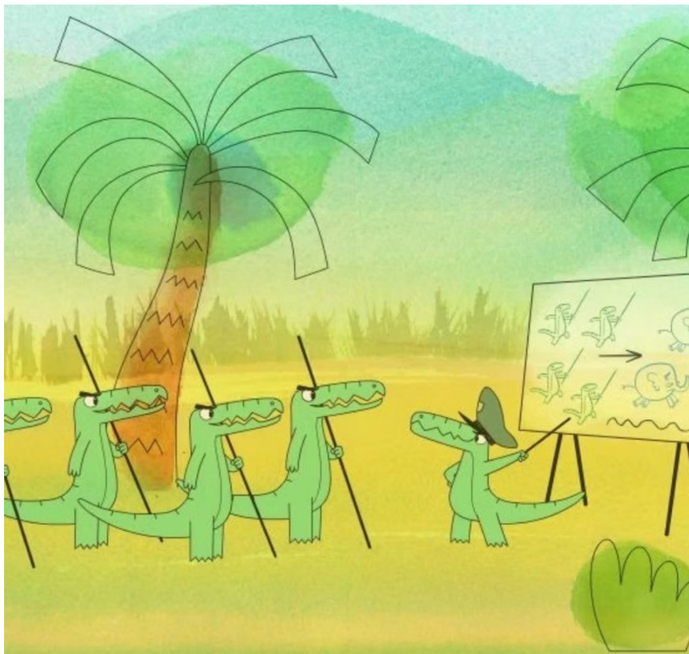
Les Plus Belles Comptines d'Okoo