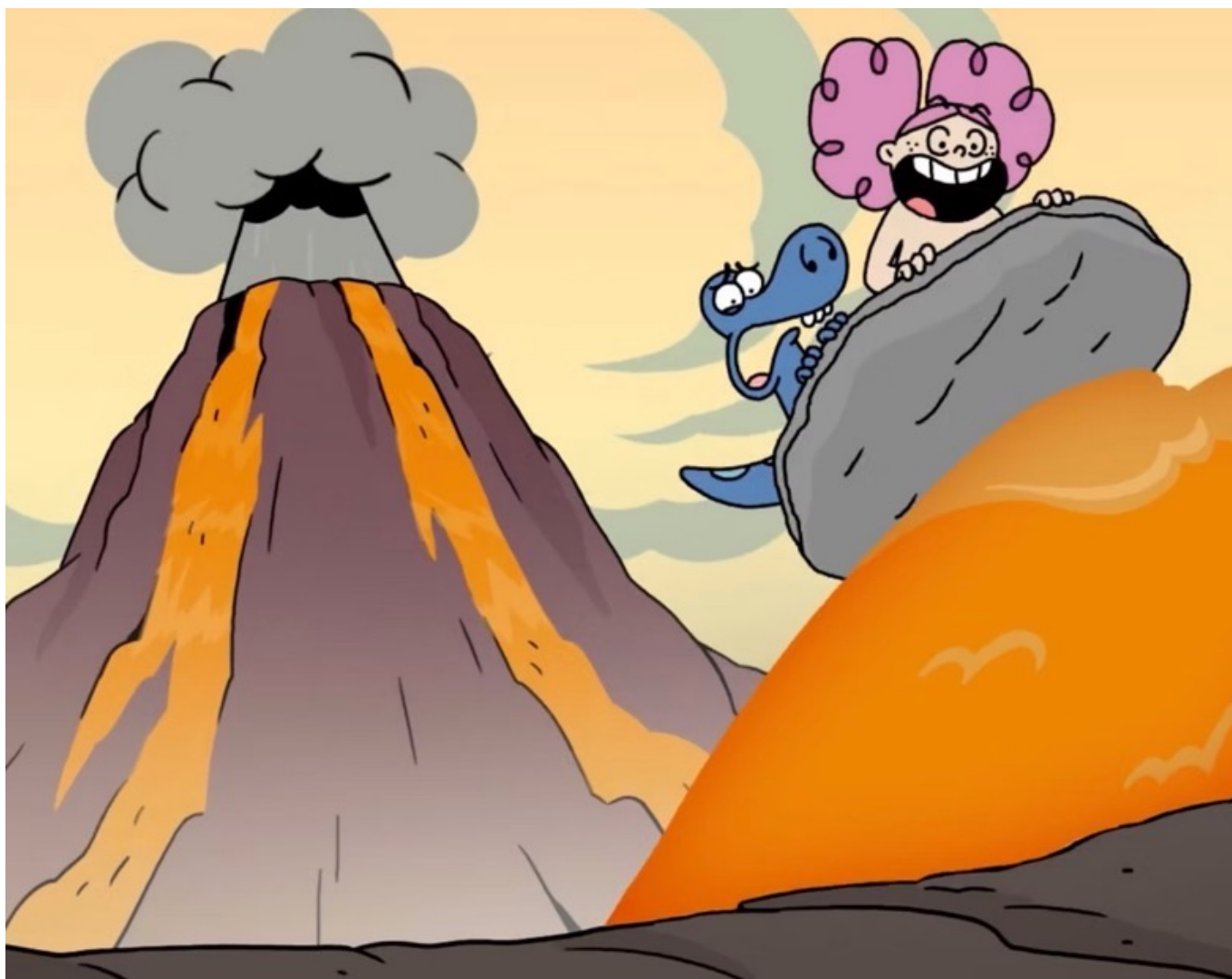
Griott & Mungo