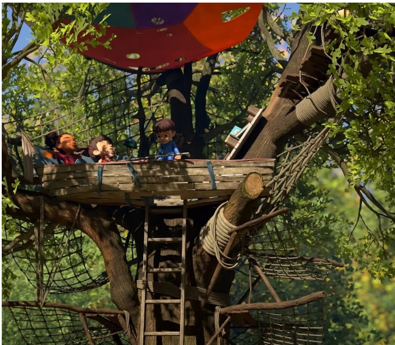
Partie de Campagne