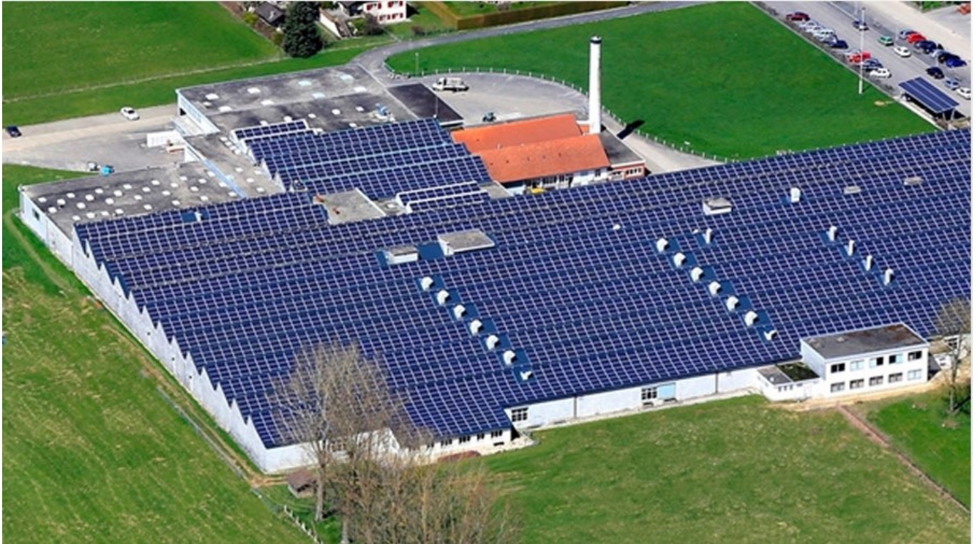
Be Energy Suisse Occidentale

entreprise historique, symbole de tradition et de modernité. Créée en 1934, la Flasa exporte son savoir-faire ancestral et technique à travers le monde entier, fournissant les acteurs du luxe et des transports notamment.