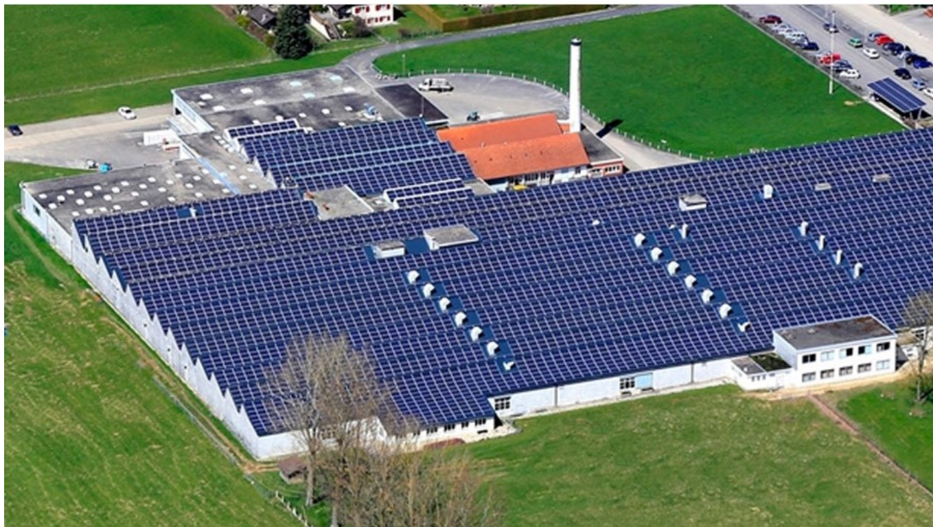
Be Energy Suisse Occidentale

entreprise historique, symbole de tradition et de modernité. Créée en 1934, la Flasa exporte son savoir-faire ancestral et technique à travers le monde entier, fournissant les acteurs du luxe et des transports notamment.