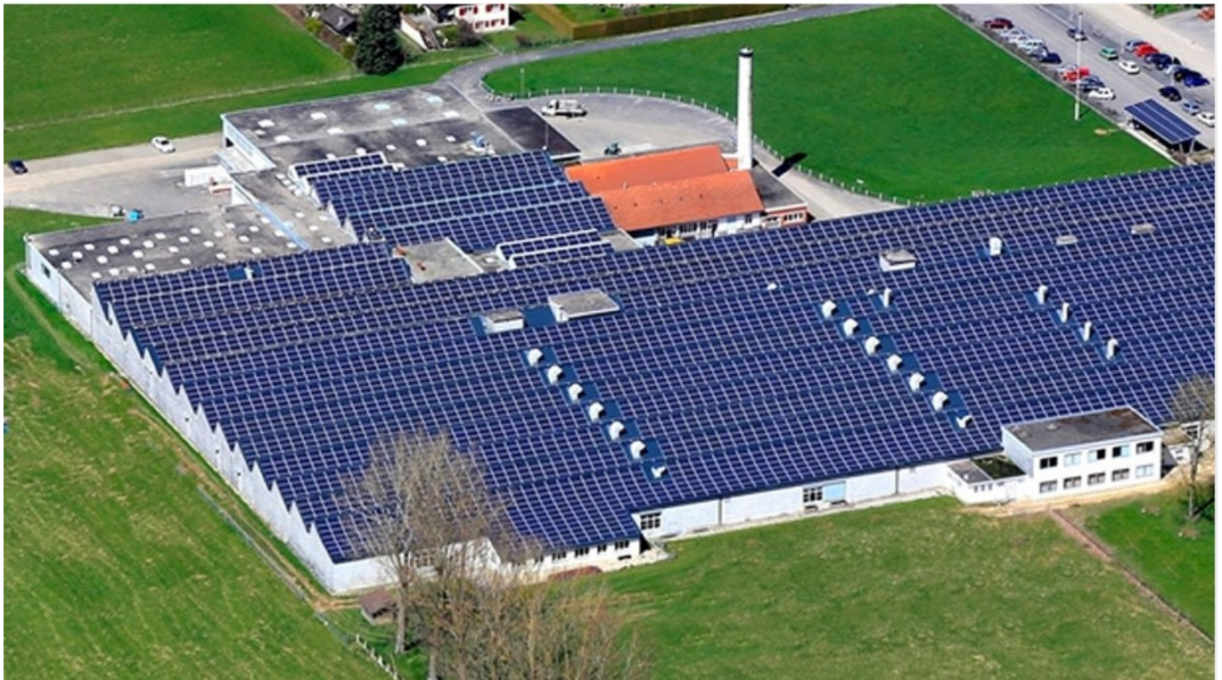
Be Energy Suisse Occidentale