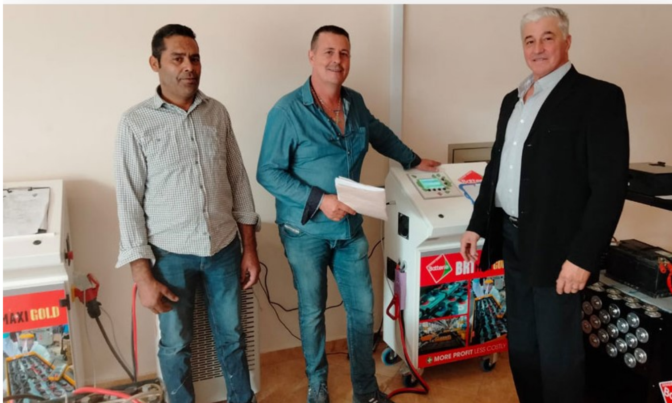
Be Energy au Sud Maroc