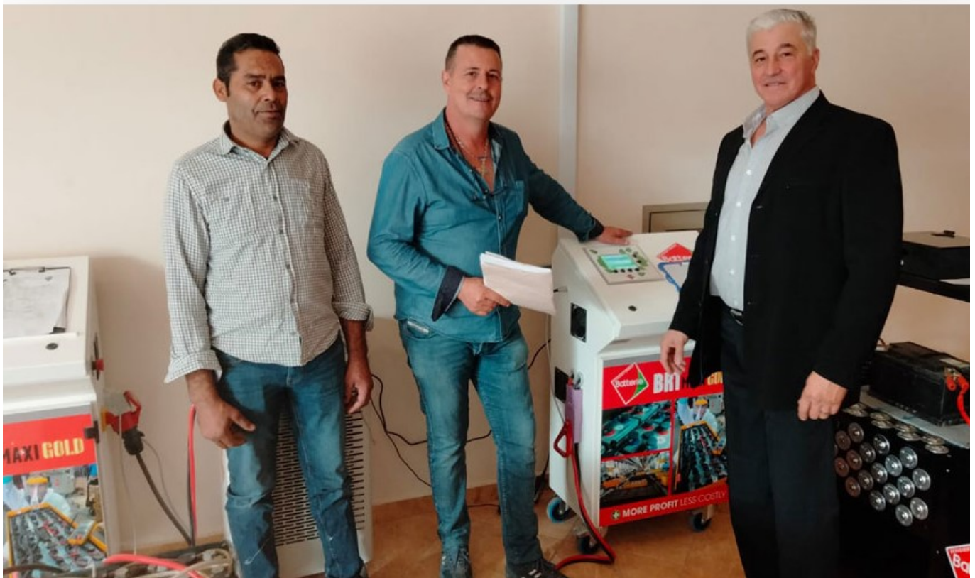
Be Energy au Sud Maroc

parfaire le parcours pour valider le savoir-faire opérationnel et, enfin, la mise en place de contrats cadres pour développer la régénération curative ainsi que les contrats de maintenance.