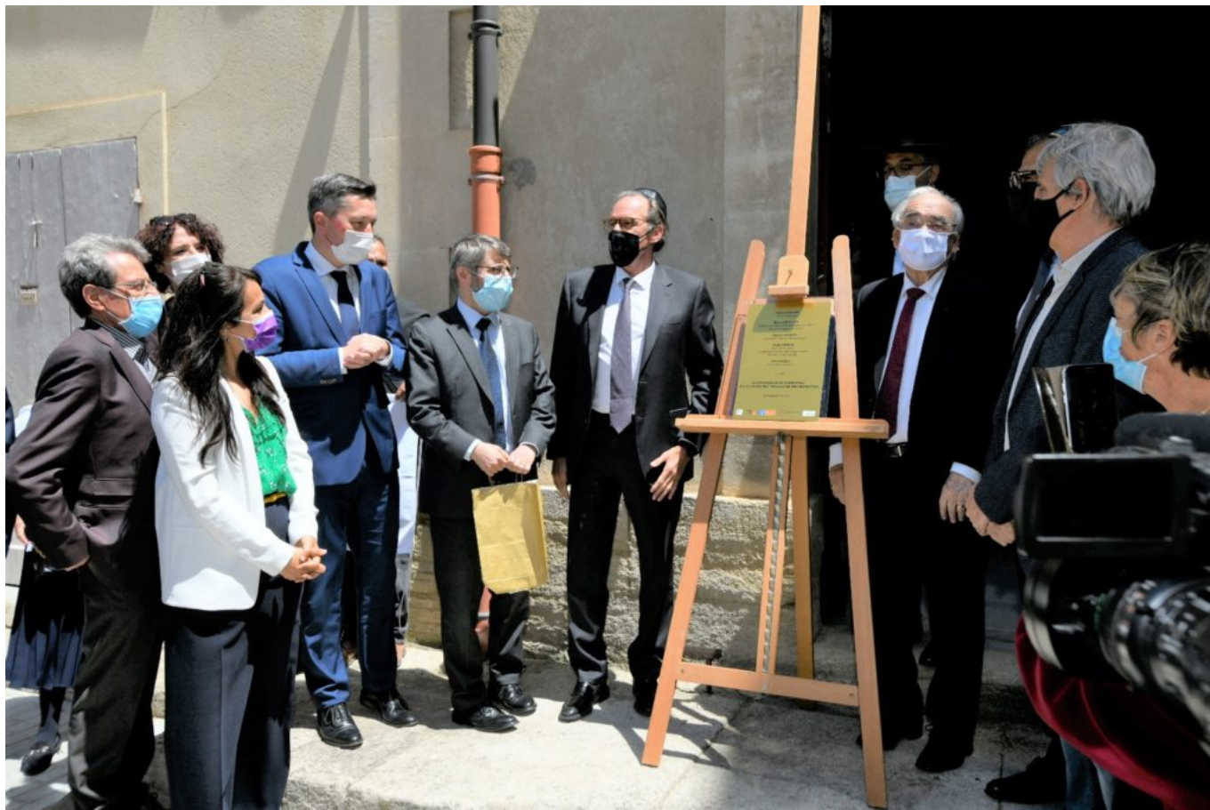
Le dévoilement de la plaque inaugurale a rassemblé un aéropage d'élus locaux et de représentants religieux.