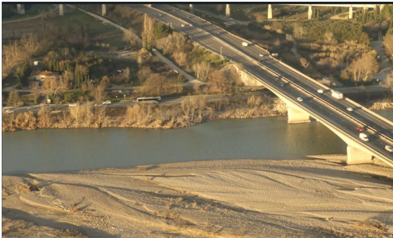
Digue de la Durance

Depuis 2018, la Communauté d'Agglomération du Grand Avignon assure la compétence pour la gestion des milieux aquatiques et de prévention des inondations. Le Syndicat Mixte d'Aménagement de la Vallée de la Durance (SMAVD), expert en conduite de projets et de travaux dans les cours d'eau, se charge de la gestion de la rivière ainsi que de la préservation des zones humides.