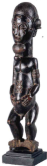
STATUE BAOUË, CÔTE D'IVOIRE. Effigie masculine aux jambes musclées. Bois à patine brune à brun noir brillante ancienne. Haut : 52 cm. 1200/1800 €