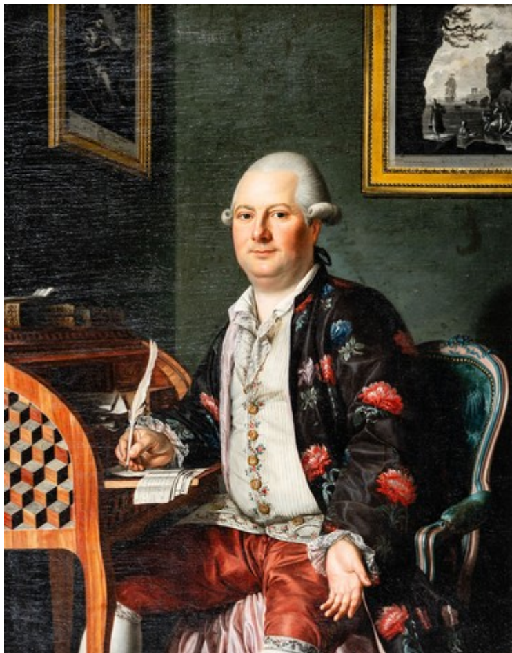
Portrait de Monsieur Noguier Antoine d'Antoine Raspal

On adorait faire rentrer le printemps à la maison avec ce bouquet de fleurs, une aquarelle de Blanche Odin (1865-1957) à partir de 200€. Et pour faire entrer quelques notes de musique, que diriez-vous d'un violoncelle français 'Plumerel à Paris, fait à Mirecourt dans la 1 re partie du 19 e siècle proposé à partir de 2 000€.