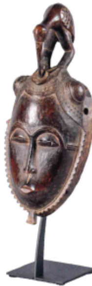
MASQUE YAHOUËRE, CÔTE D'IVOIRE surmonté d'une coiffure représentant un oiseau en ronde-bosse. Bois à patine brune nuancée rouge, pièce de monnaie. Haut : 36 cm. 3000/4000 €