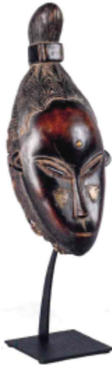
MASQUE GOURO, CÔTE D'IVOIRE représentant le portrait d'une jeune fille de la communauté Gouro réputée pour sa beauté. Bois à patine brune, alliage de cuivre. Haut : 35 cm. 2000/3000 €