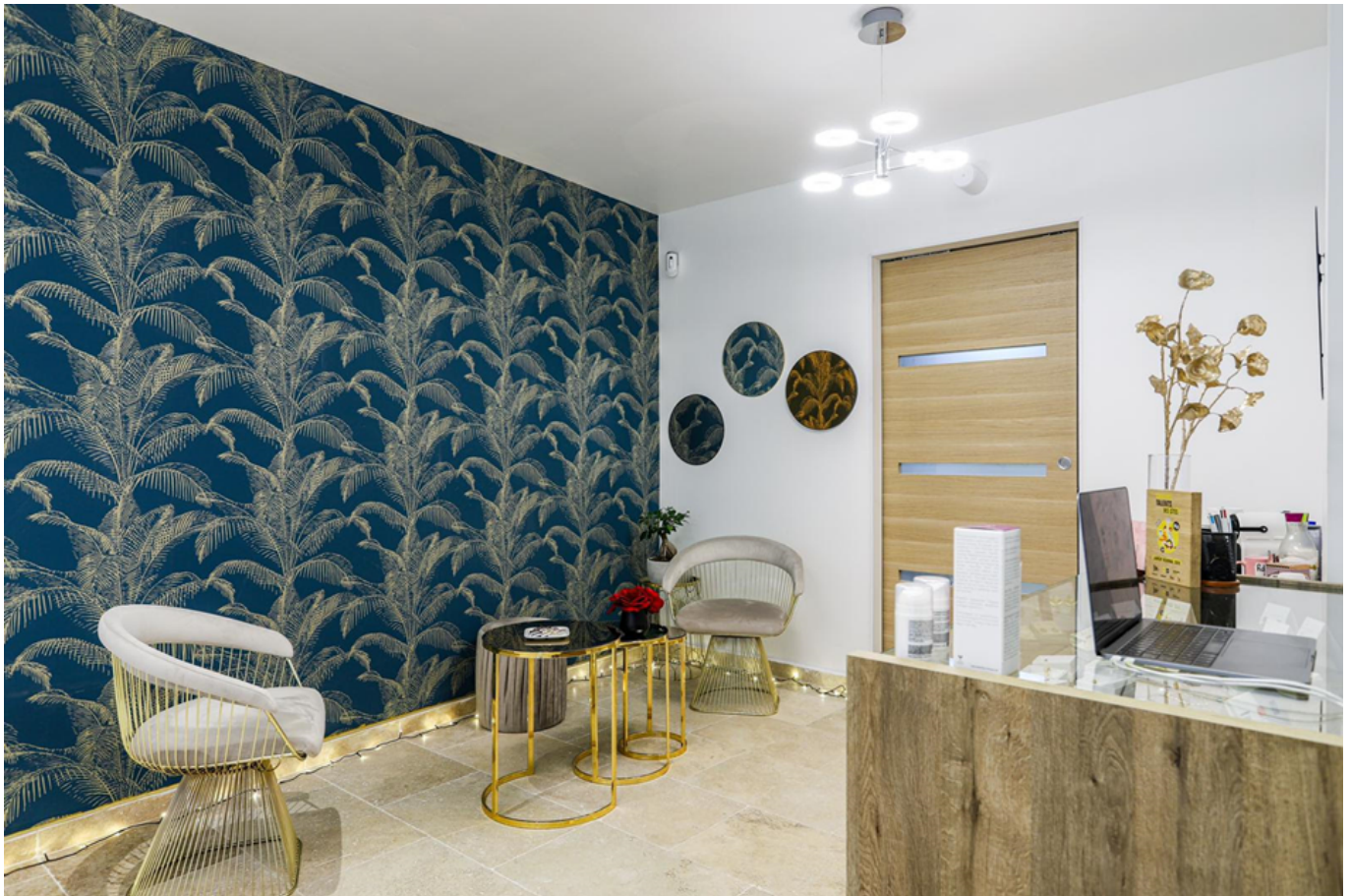
L'Institut 'Dermo Beauty by S' se situe 32 rue Proudhon à Tarascon.