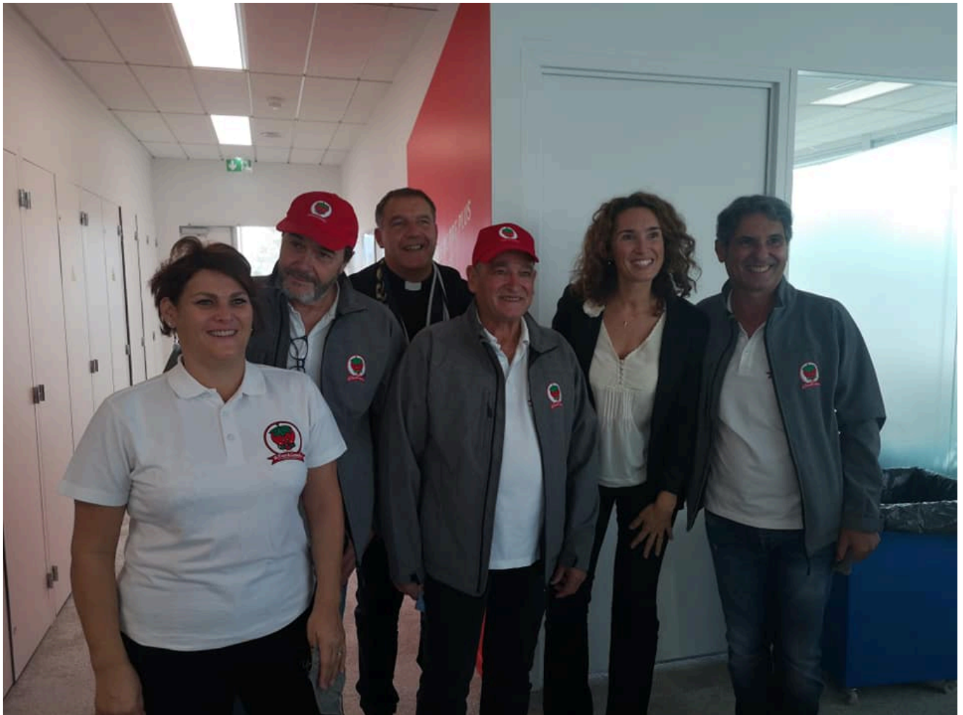
La confrérie au côté de la journaliste Marie-Sophie Lacarrau.