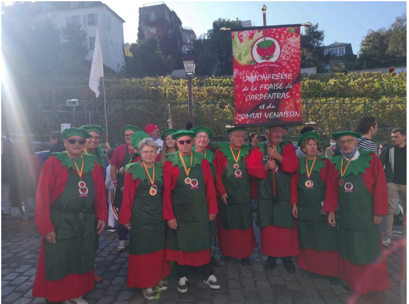
Dans les starting-block pour le défilé des vendanges à Montmartre