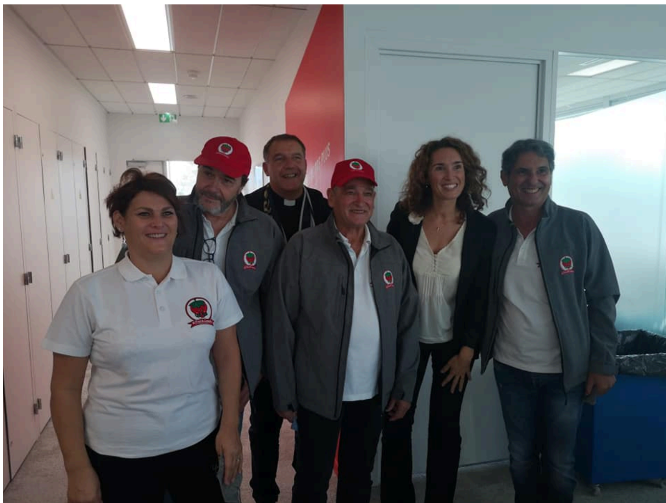
La confrérie au côté de la journaliste Marie-Sophie Lacarrau.