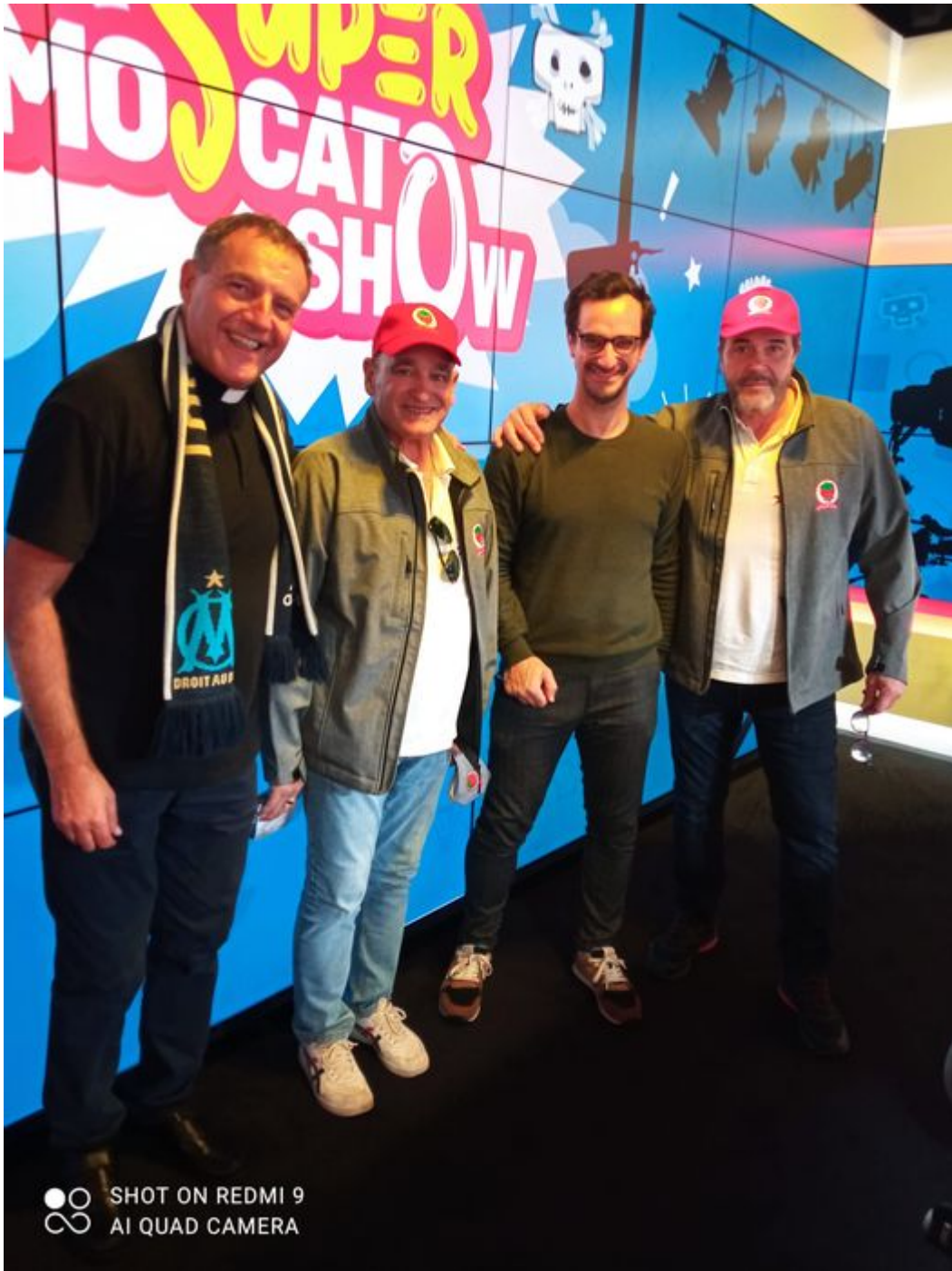
Photo souvenir sur le plateau du Super Moscato show