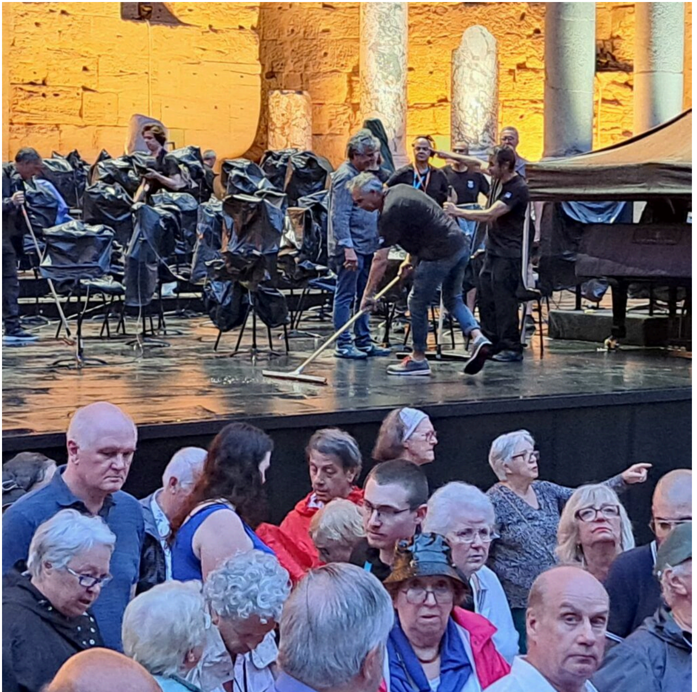
Corps de... « balais »...sur scène