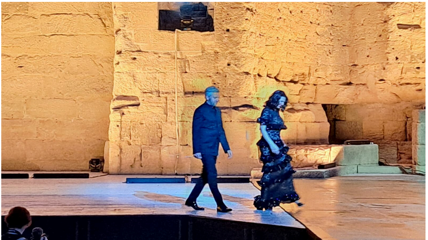
Khatia Buniashvili arrive pour la 1 ere fois sur la scène du Théâtre Antique suivie du chef Kirill Karabits.

La star entame alors l'allegro du célèbre concerto n°1 de Tchaïkovski que tout le monde connaît, mais qui, sous ses doigts, son toucher, donne une autre résonance. Au 3 e rang, c'est-à-dire à moins de dix mètres, tout du jeu de Khatia Buniashvili est perceptible : les vibrations du piano, la puissance, la force, l'énergie de la main gauche, le timbre tempétueux et volcanique de la géorgienne puis la douceur caressante des pianissimi, comme des perles de pluie. Sa gestuelle, ses balancements lascifs, sa tignasse brune et bouclée qu'elle envoie en arrière quand elle attaque des montées chromatiques d'un bout à l'autre du clavier, les musiciens qu'elle entoure de ses bras, les regards complices qu'elle échange avec le chef Kirill Karabits. Le public est subjugué, il retient son souffle et exulte à la fin du 1 er mouvement.