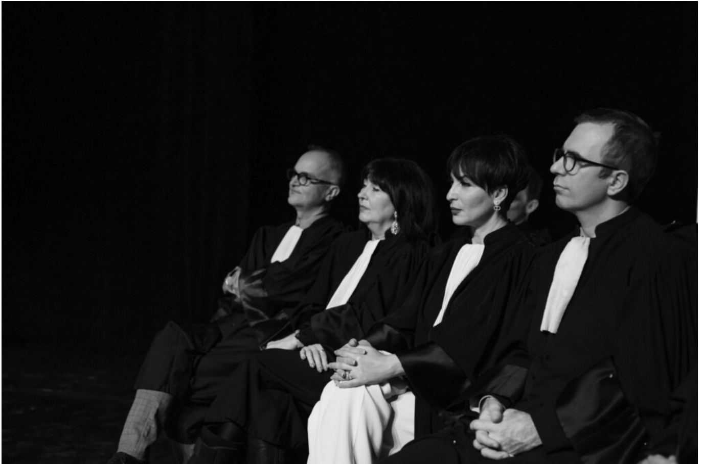
Les bâtonniers.