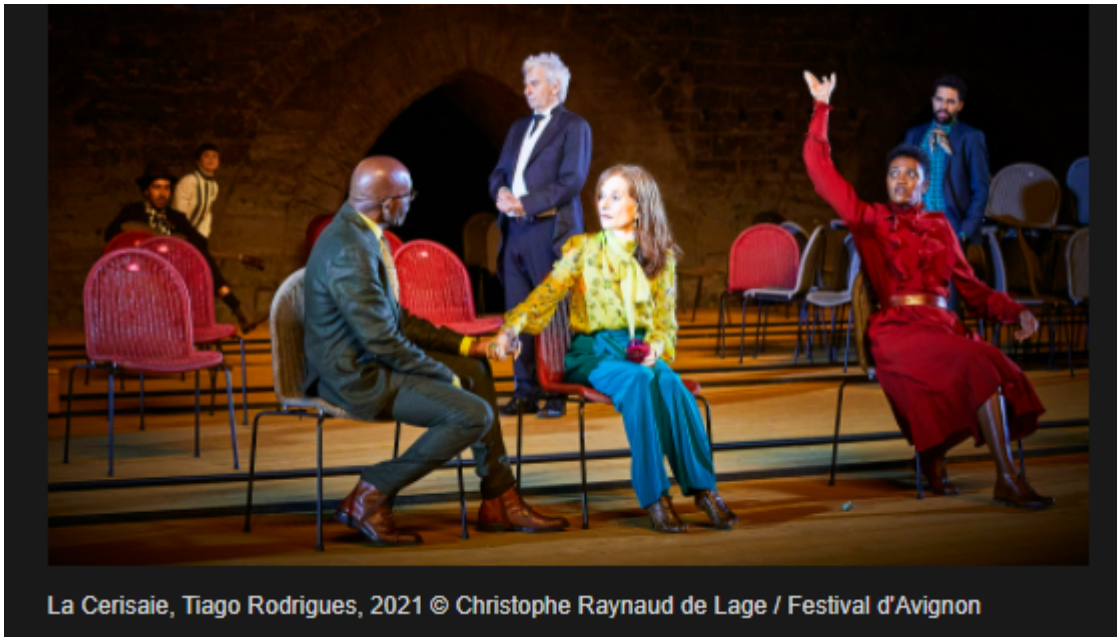
La Cerisaie, Tiago Rodrigues, 2021