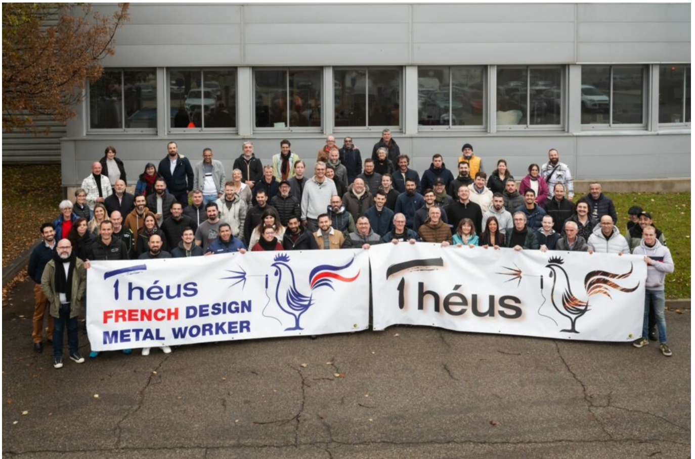
L'équipe de Theus Industrie