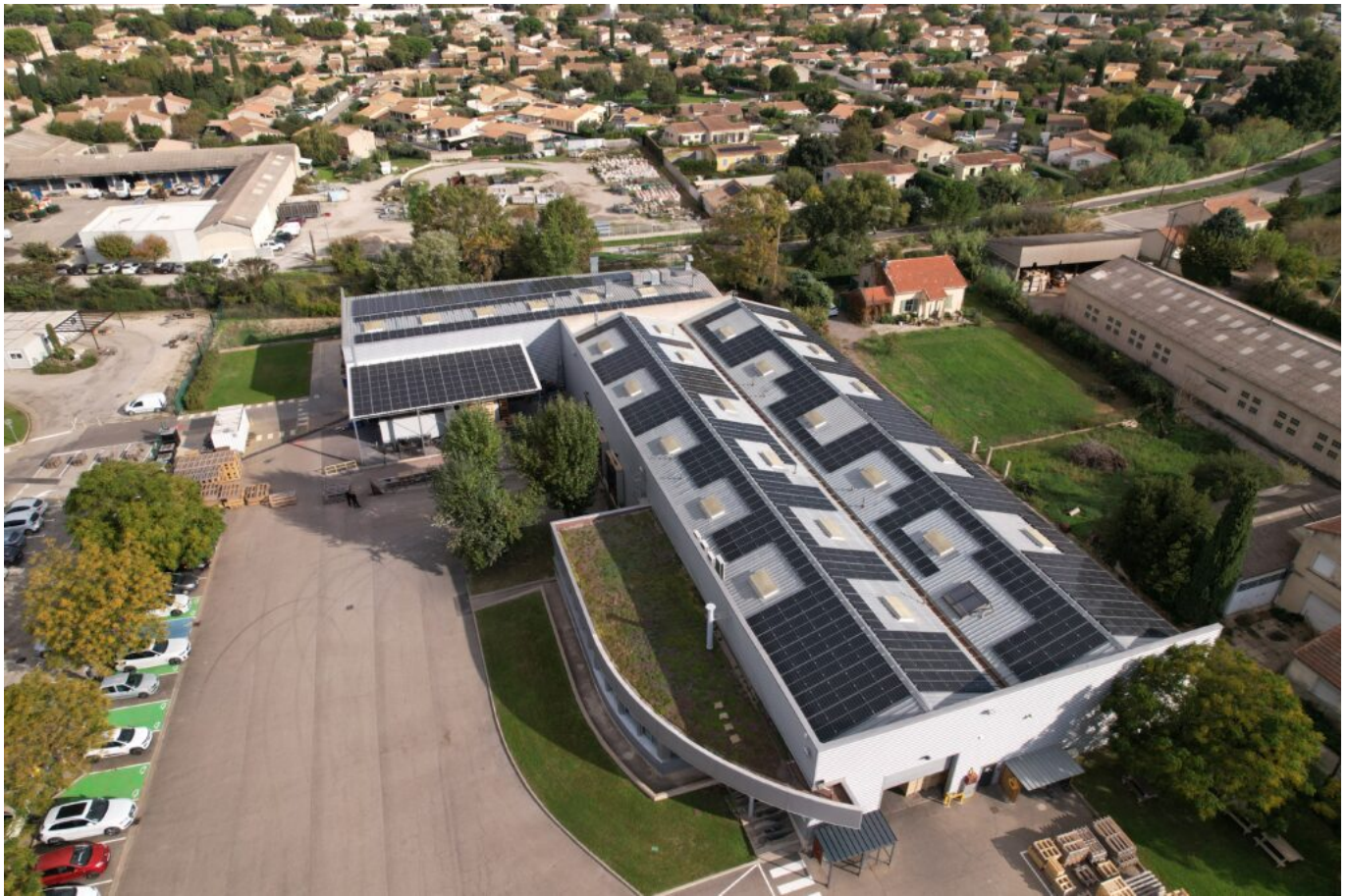
Le site de Cavaillon

Avec 700 panneaux sur une surface de 2 400 M 2 l'entreprise couvre aujourd'hui en moyenne annuelle 64 % de ses besoins. Une belle performance. L'investissement de 400 K€ sera remboursé en moins de 5 ans. Il a été financé pour part essentielle par un emprunt bancaire avec l'apport d'une subvention de 51 932 € de la région PACA dans le cadre du programme Solaire Ready. Cet apport a permis le financement des travaux de consolidation de la toiture du bâtiment d'accueil des panneaux. « Notre banque nous a suivi assez facilement car l'investissement est immédiatement rentable » complète Sophie Kirnidis.