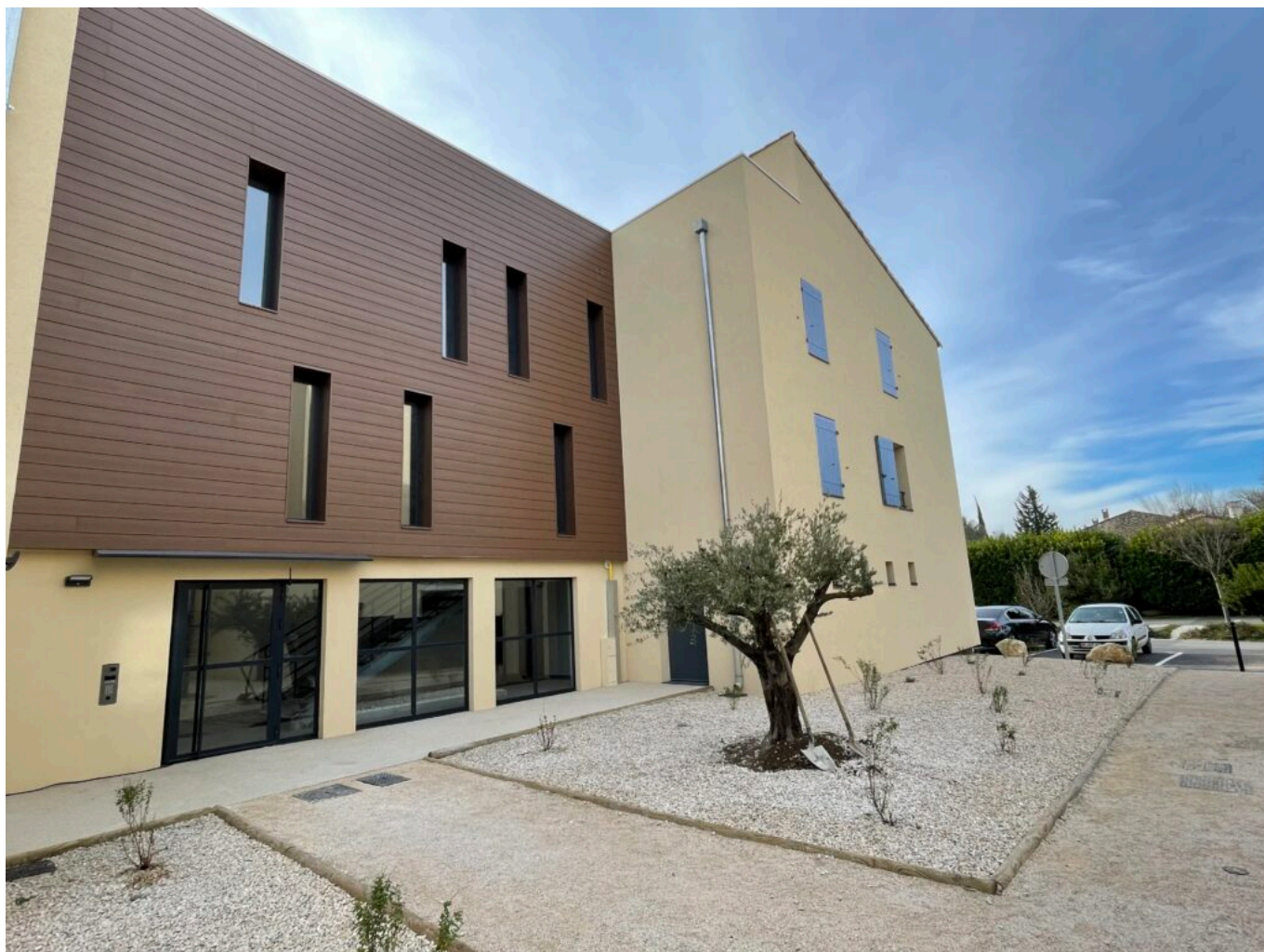
Les Glycines au Thor Copyright MMH

C'est le cas de Grand Delta Habitat dans sa forme actuelle avec les défis à relever : la démolition de bâtiments datant des années 1970 qui ne sont plus adaptés à la vie actuelle, la réhabilitation, la construction et l'innovation. Le logement est un levier d'émancipation et de développement familiaux et de mixité sociale, ce qui participe à l'épanouissement de notre société.»