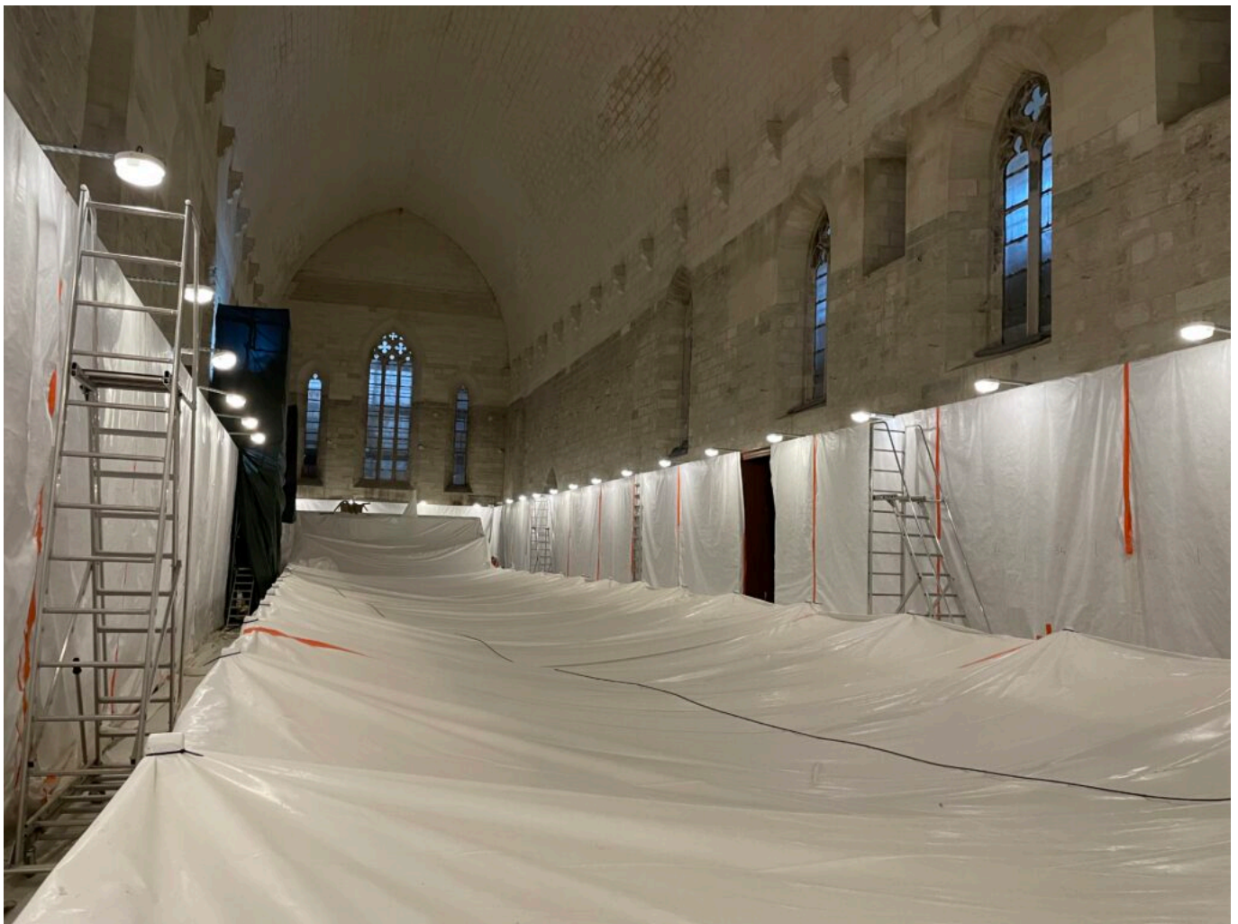
La Chapelle Benoît XII entièrement bâchée