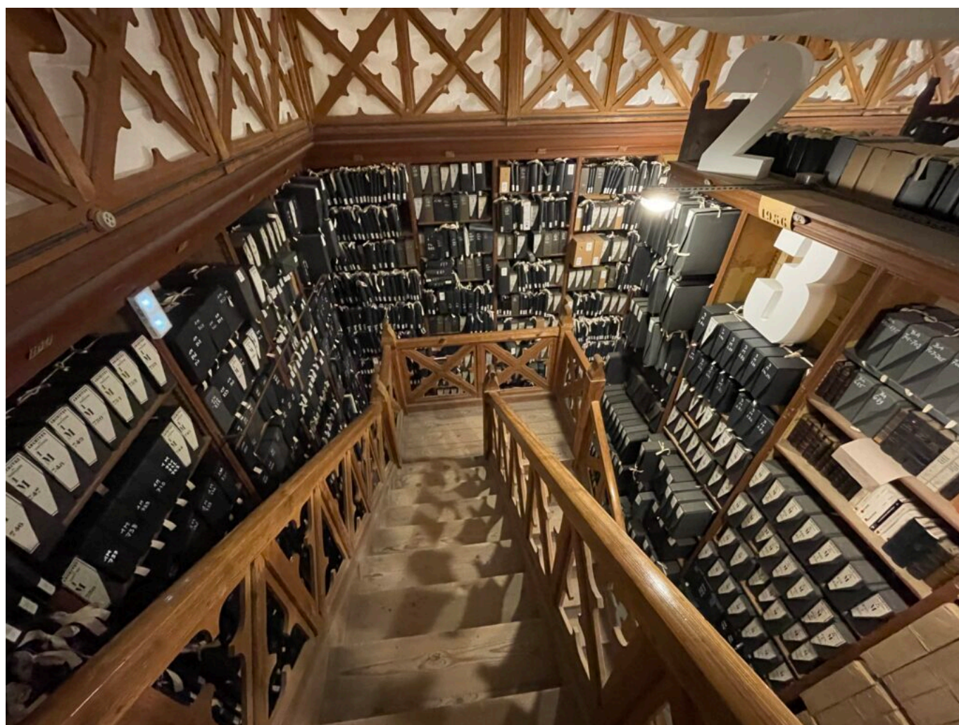
Sous les bâches les Archives départementales