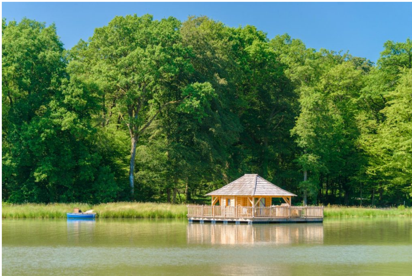
Cabane flottante

Le caractère insolite peut provenir de différents aspects : la nature de l'hébergement (une yourte, dans un arbre, sur un bateau, dans un château, dans une roulotte, dans une grange, dans un train), le lieu de l'hébergement (en haute montagne, à la ferme, sur une île, sous terre, dans les airs, sur l'eau, en mouvement), la qualité des hôtes de par leur profession (agriculteurs, pêcheurs, chasseurs, vignerons), leur culture (musique, poésie), leur langue ou leurs traditions. Également parmi les critères, les activités proposées (artisanat, activités à la ferme, élevage, pêche, découverte d'une civilisation).