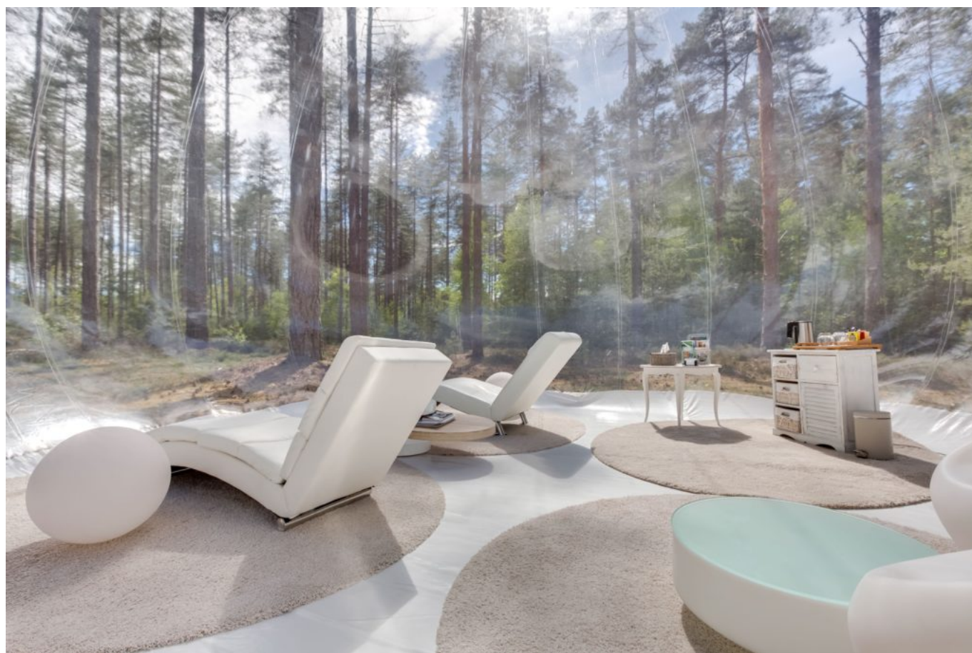
Bulle de cristal