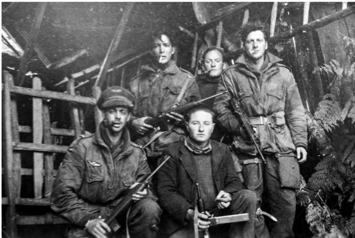
Militaires de l'armée américaine et résistants