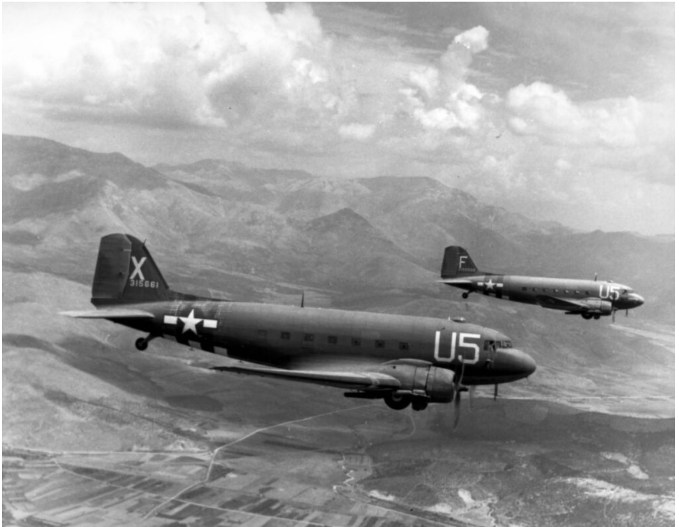
Deux Douglas C-47 skytrains