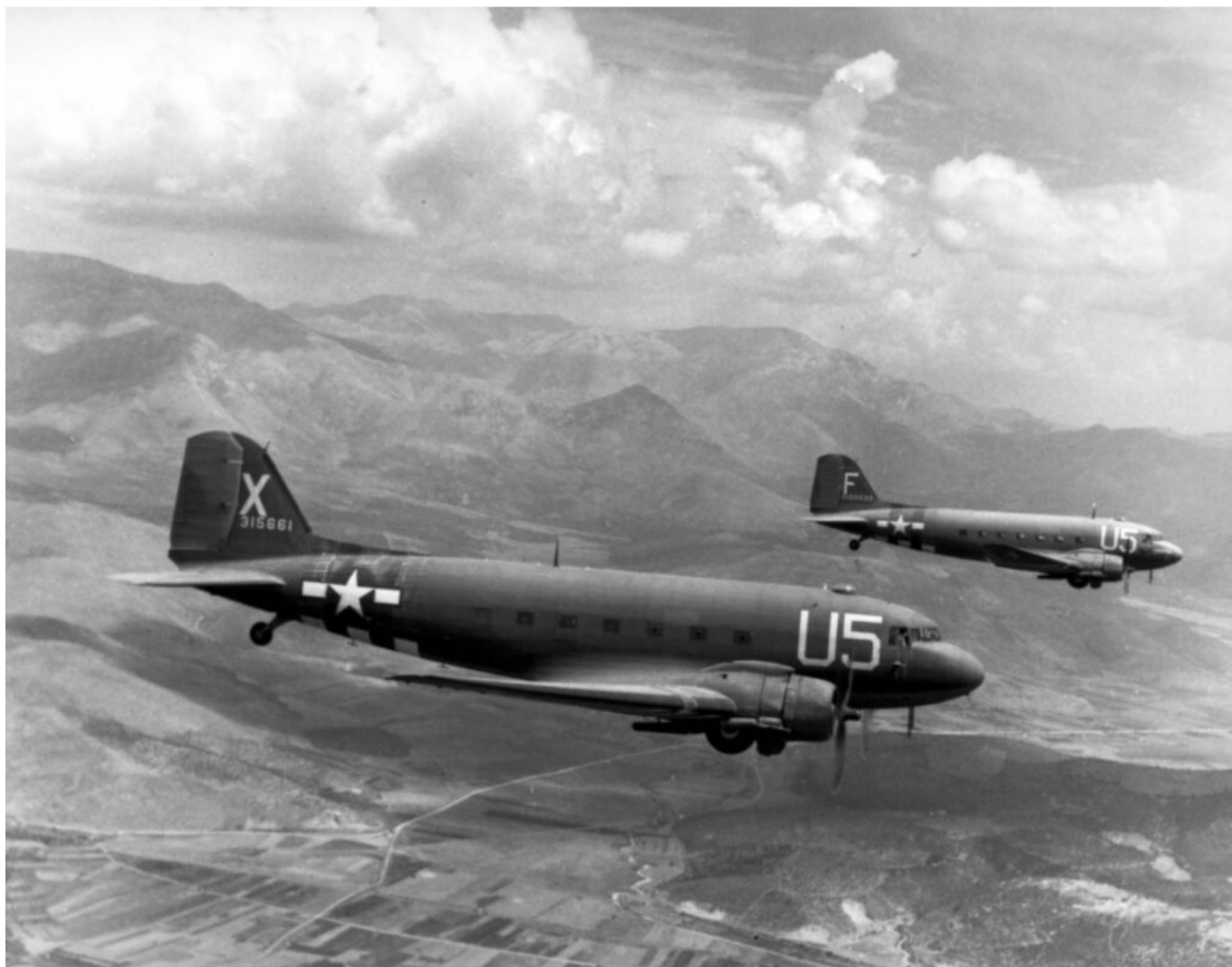
Deux Douglas C-47 skytrains