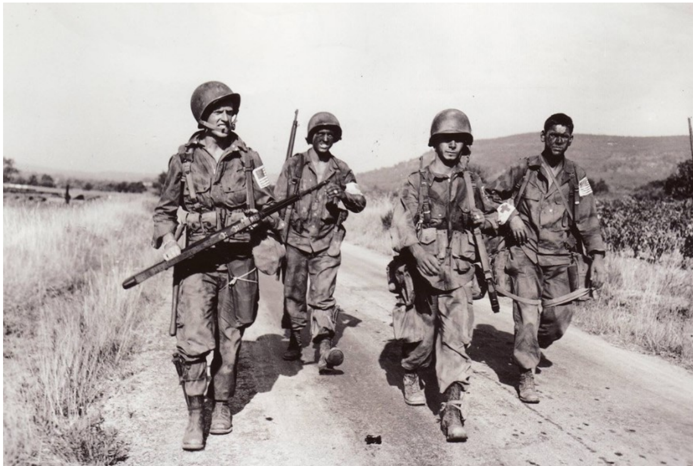
Militaires américains lors du débarquement de Provence

libération du Sud de la France en août 1944.