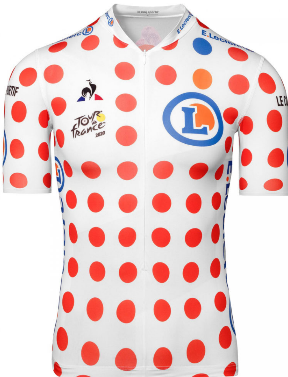
Emblématique maillot à pois.