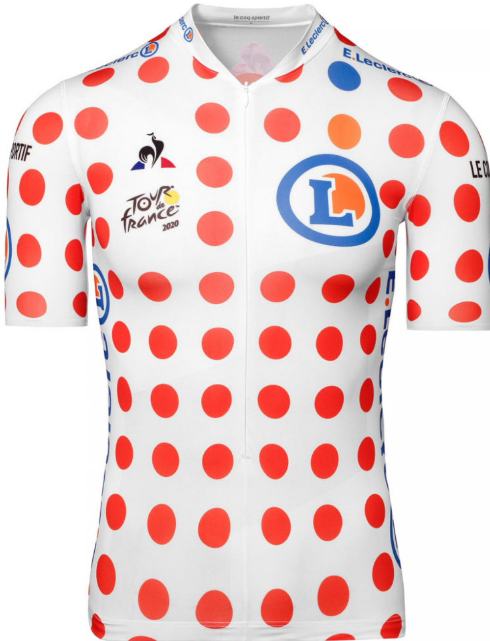
Emblématique maillot à pois.