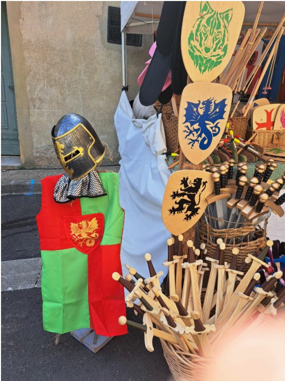
Tenues médiévales et épées pour enfants