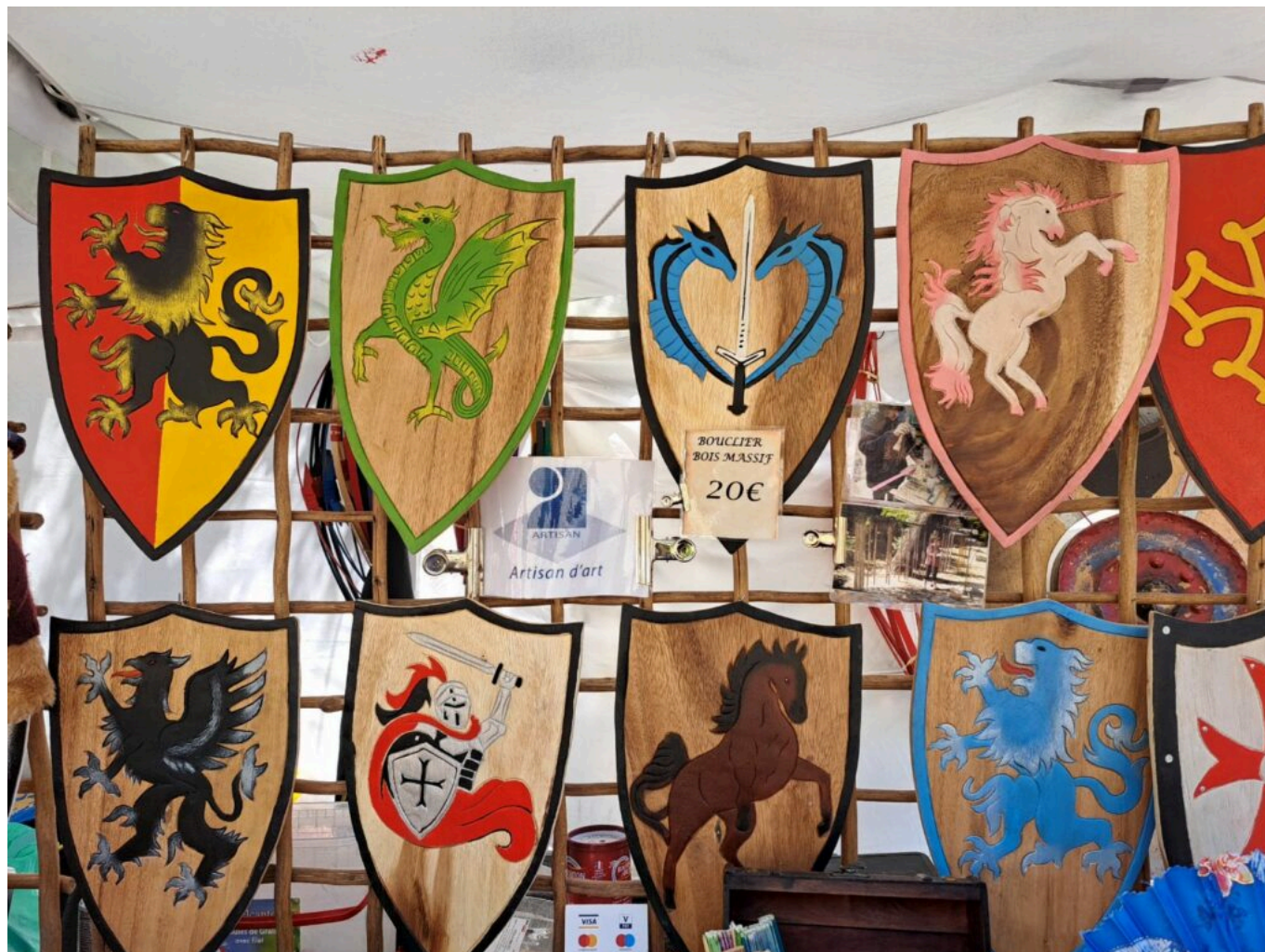
Les boucliers et leurs bannières héraldiques

Sur la Place des Ripailles ou de la Fontaine comme sur le parvis de la Chapelle Saint-Théodorit, jongleurs, cracheurs de feu, troubadours, fauconniers, chevaliers, écuyers, soldats sous leurs armures, danseurs, saltimbanques, joueurs de cornemuse animent le village.