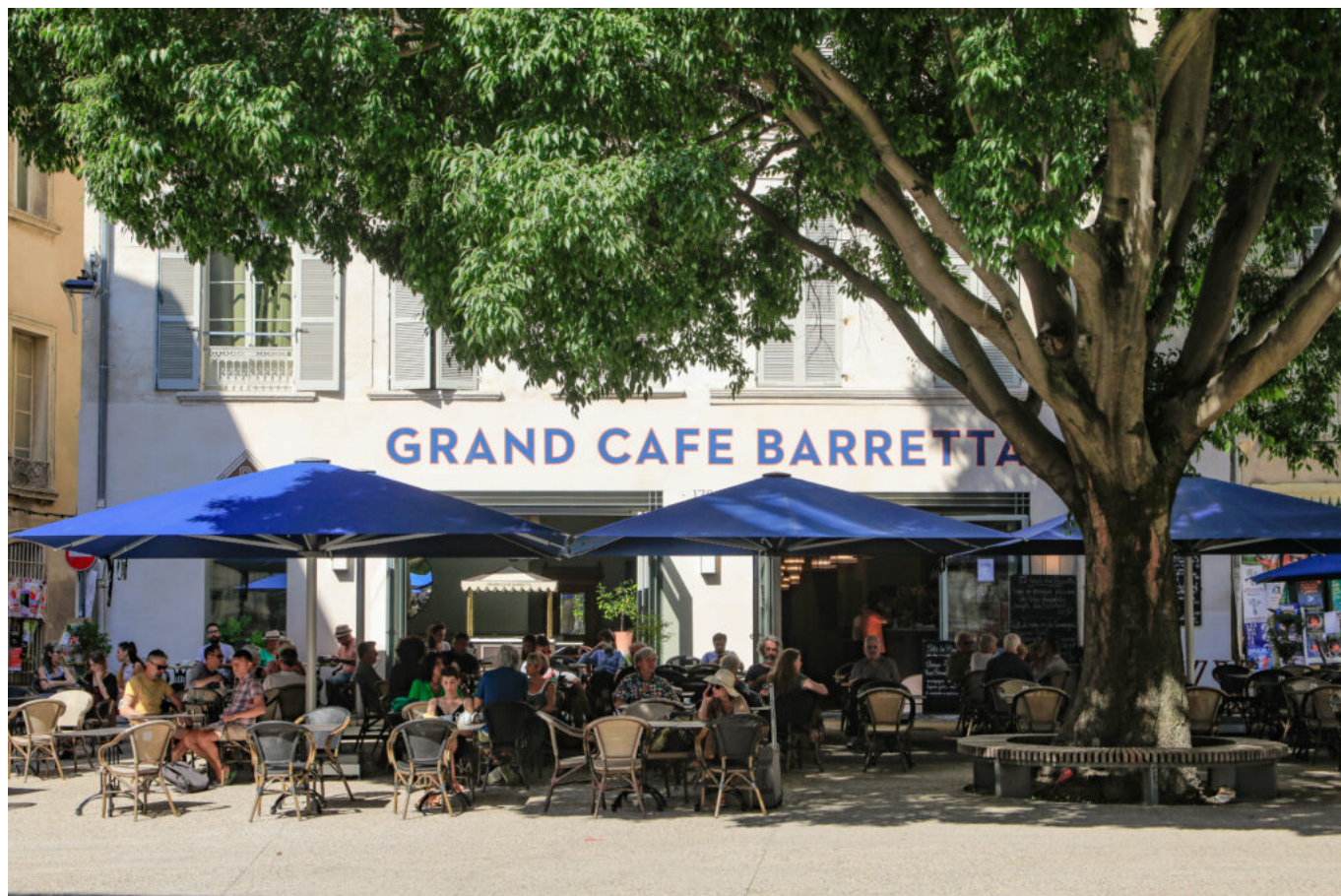
Avignon veut jouer la carte d'un tourisme apaisé à taille humaine.

vers un tourisme expérientiel et insolite', ces trois rendez-vous ont ainsi permis de donner la parole aux professionnels du secteur (hôteliers, restaurateurs, cafetiers, hébergeurs, transporteurs, prestataires, organisations professionnelles...) ainsi qu'à tous ceux qui, de près ou de loin, sont concernés par les retombées de l'activité touristique (collectivités, chambres consulaires, commerçants, acteurs culturels, riverains, ou simple citoyen).