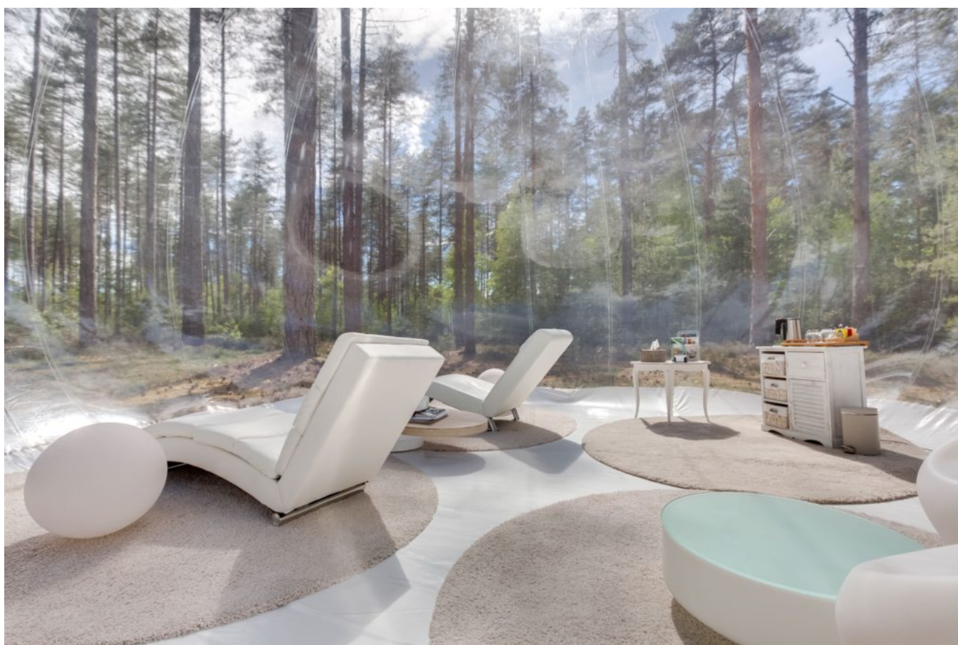
Bulle de cristal