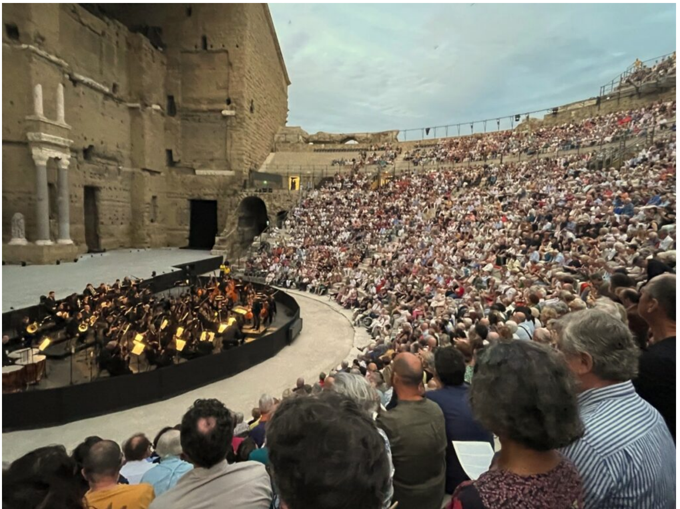
Théâtre antique d'Orange

Pour autant, cette progression régionale reste modérée face à d'autres destinations françaises. En Nouvelle-Aquitaine (département jumeau du Vaucluse à bien des égards) , par exemple, la hausse des nuitées atteint +3,7 %, et certaines régions comme l'Île-de-France affichent des croissances à deux chiffres. Ce contraste interrégional souligne les défis structurels de Paca : saturation des infrastructures face à la demande, concurrence accrue des littoraux méditerranéens voisins comme en Espagne, qui a parfois devancé la Côte d'Azur dans les demandes de réservation, ou encore saisonnalité marquée.