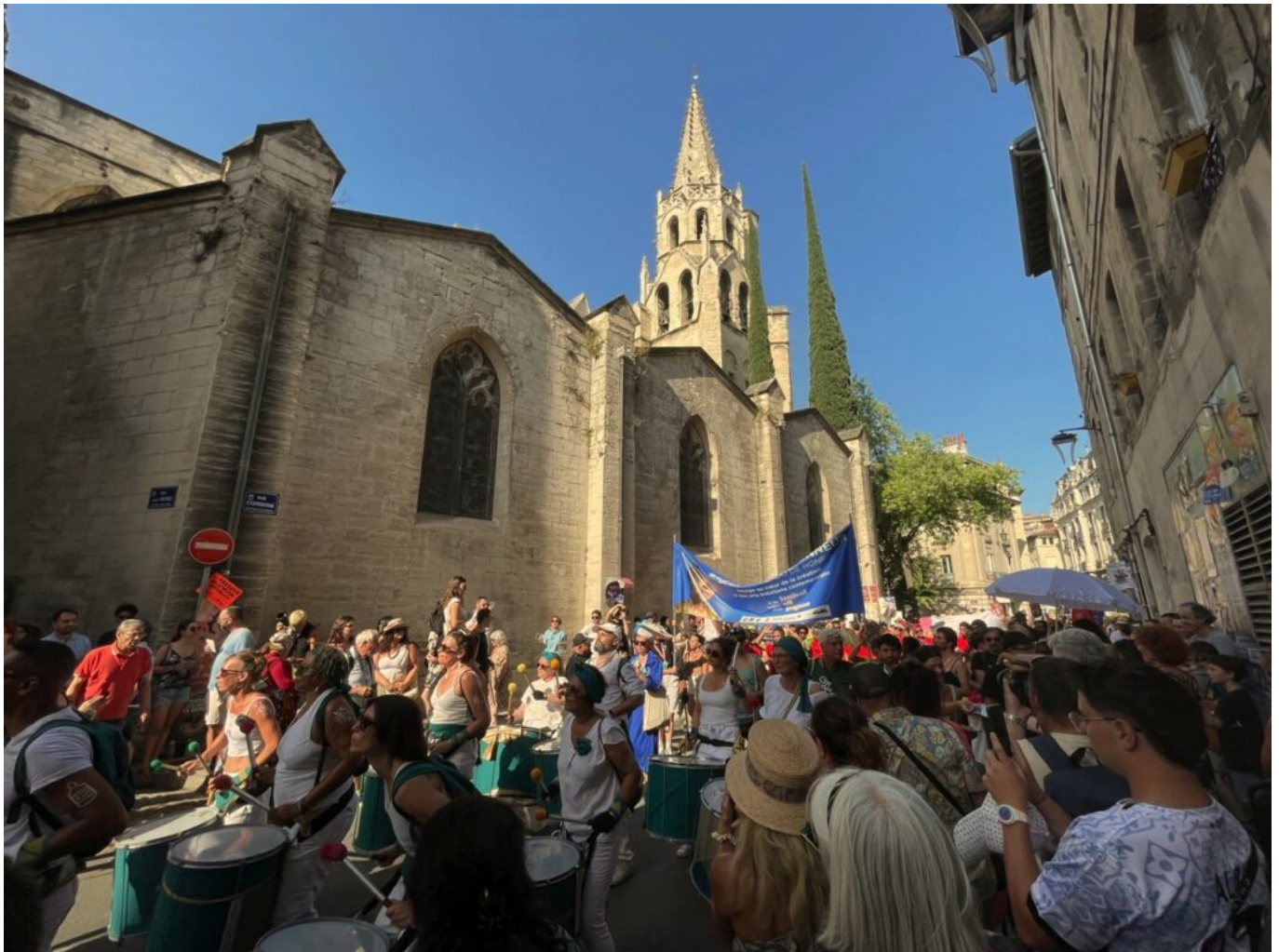
Festival off d'Avignon

Le panorama départemental illustre cette diversité : les Bouches-du-Rhône ont totalisé 4,4 millions de nuitées, dont près de 30% de non-résidents français, et affichent une progression soutenue grâce à l'international. Les Hautes-Alpes, malgré leur plus faible volume -environ 0,5 million-, montrent également une forte progression des touristes étrangers.