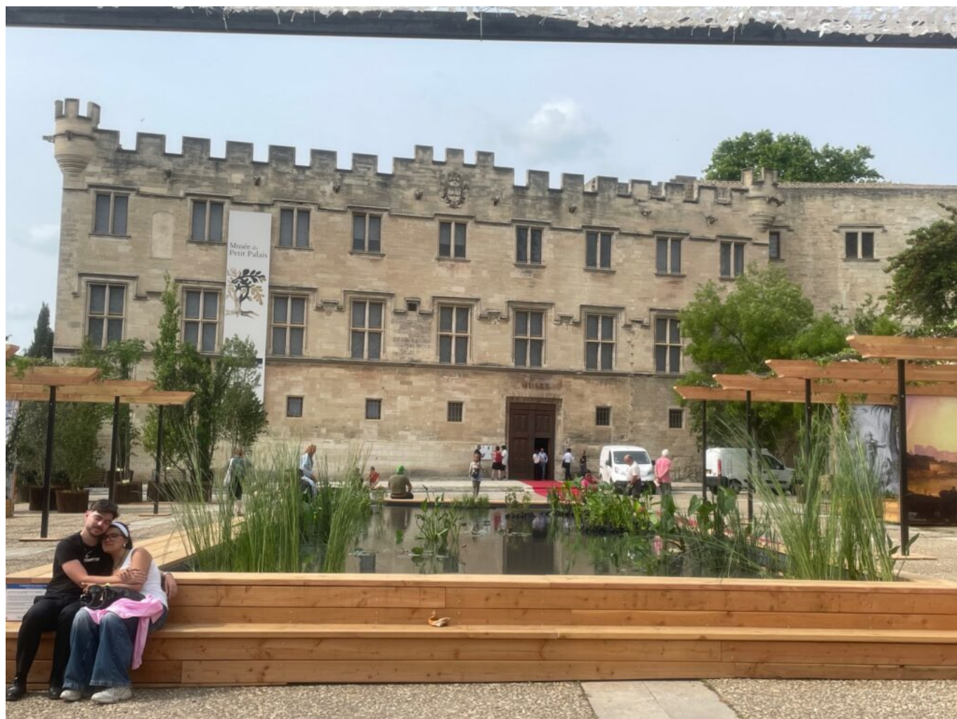
Petit Palais Avignon