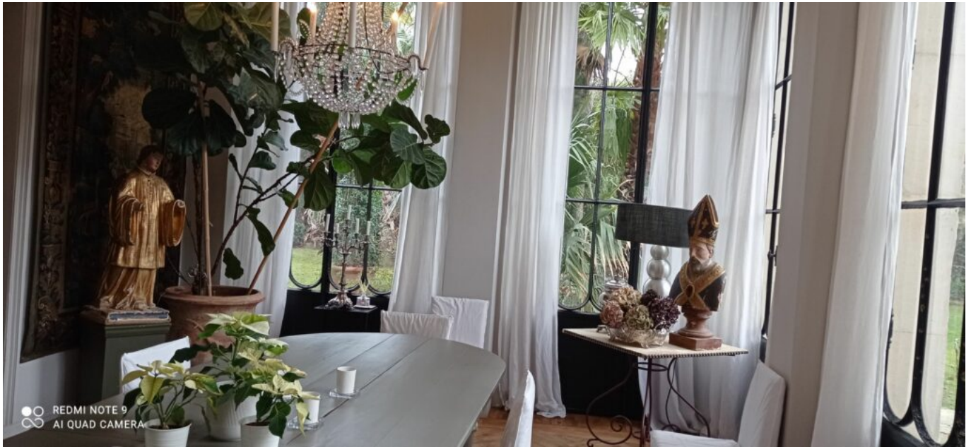
La Divine Comédie.

géants. Le Complot sera un lieu qui s'adapte et ne sera pas un bar ouvert au public. Il pourra cependant se louer en petit comité pour cocktail dînatoire ou une retraite bien-être par exemple. Avec possibilité de louer tout le lieu avec ses trois belles suites au premier étage.