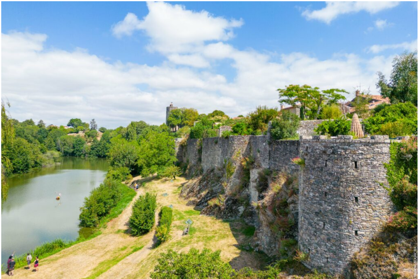
Vouvant, Fontenay-le-comte, Vendée