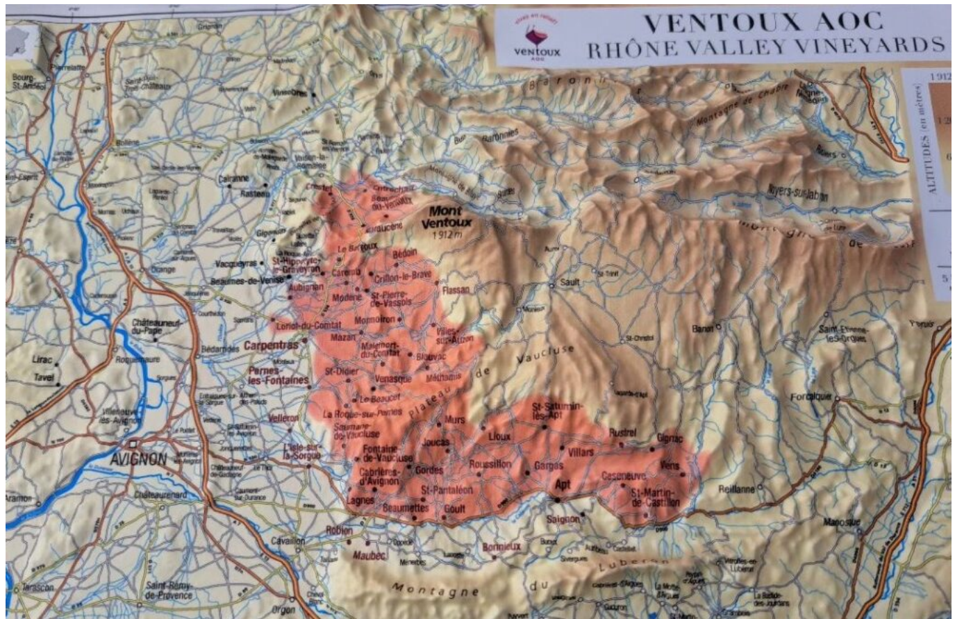
Carte de l'AOC Ventoux.