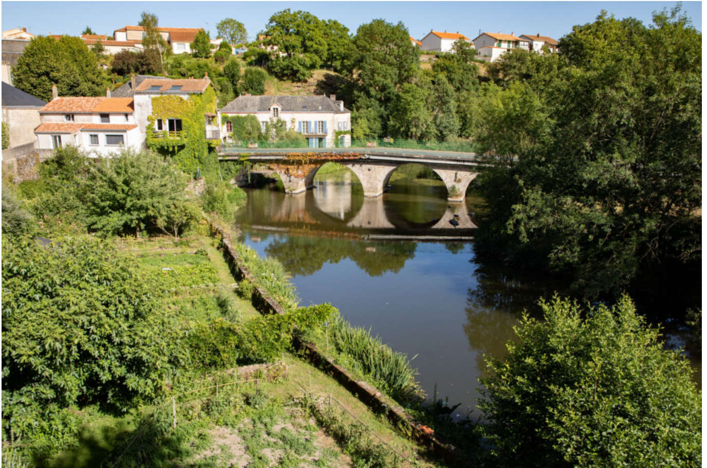
Sèvre, Vendée, Mallièvre ©Jean-philippe Berlose