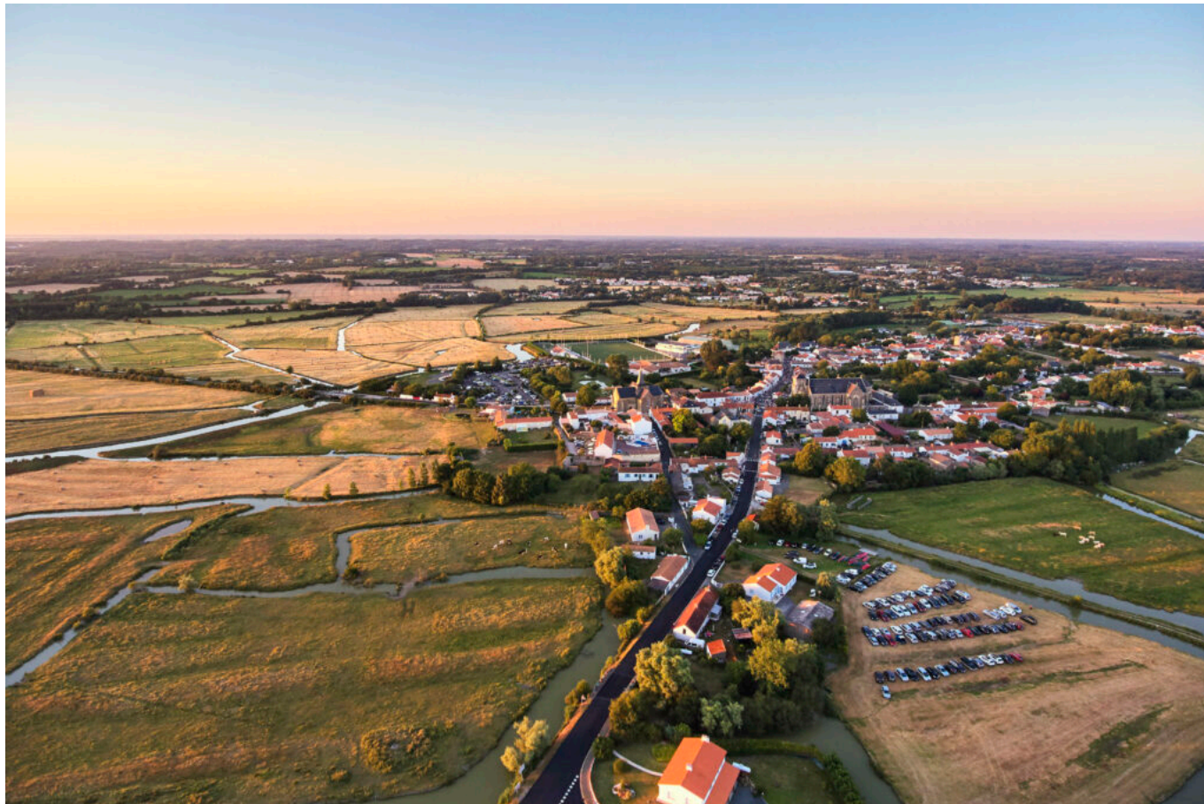
Sallertaine, vue panoramique, Vendée

Artisanat, art, Vente, Sallertaine