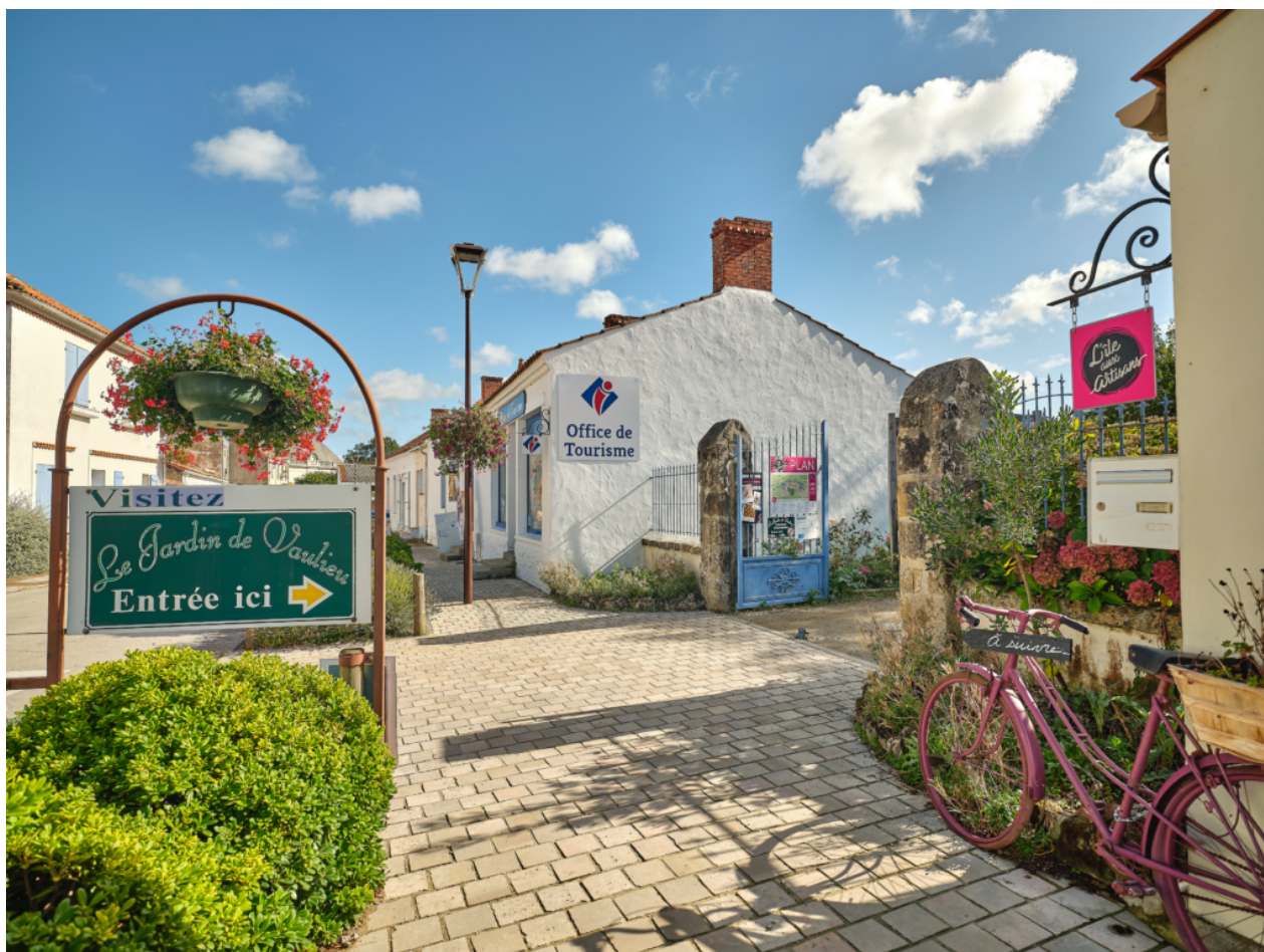
Le village de Sallertaine.