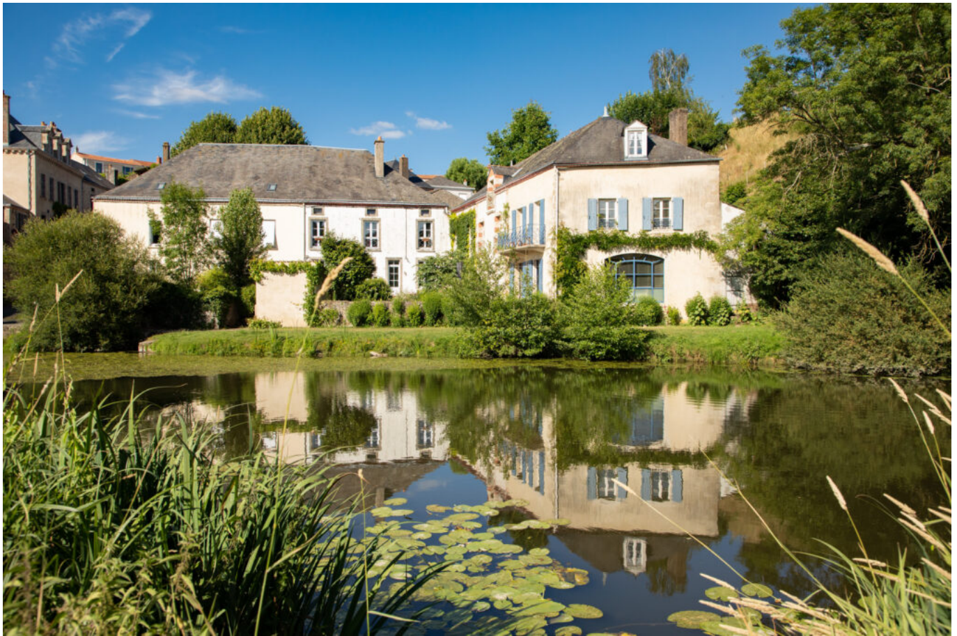
Sèvre, Vendée, Mallièvre