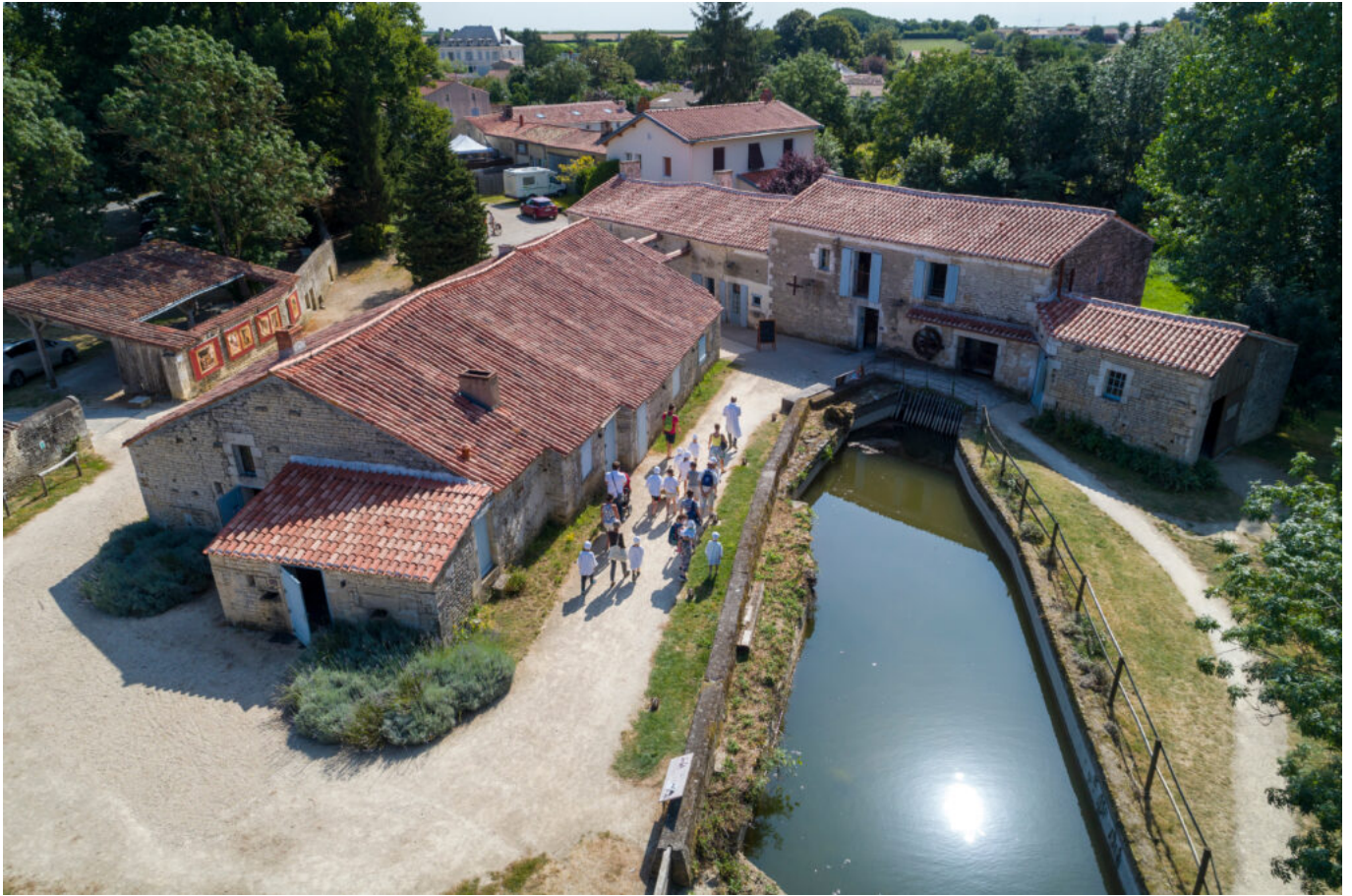
La Maison de la meunerie, à Rives-d'Autise.