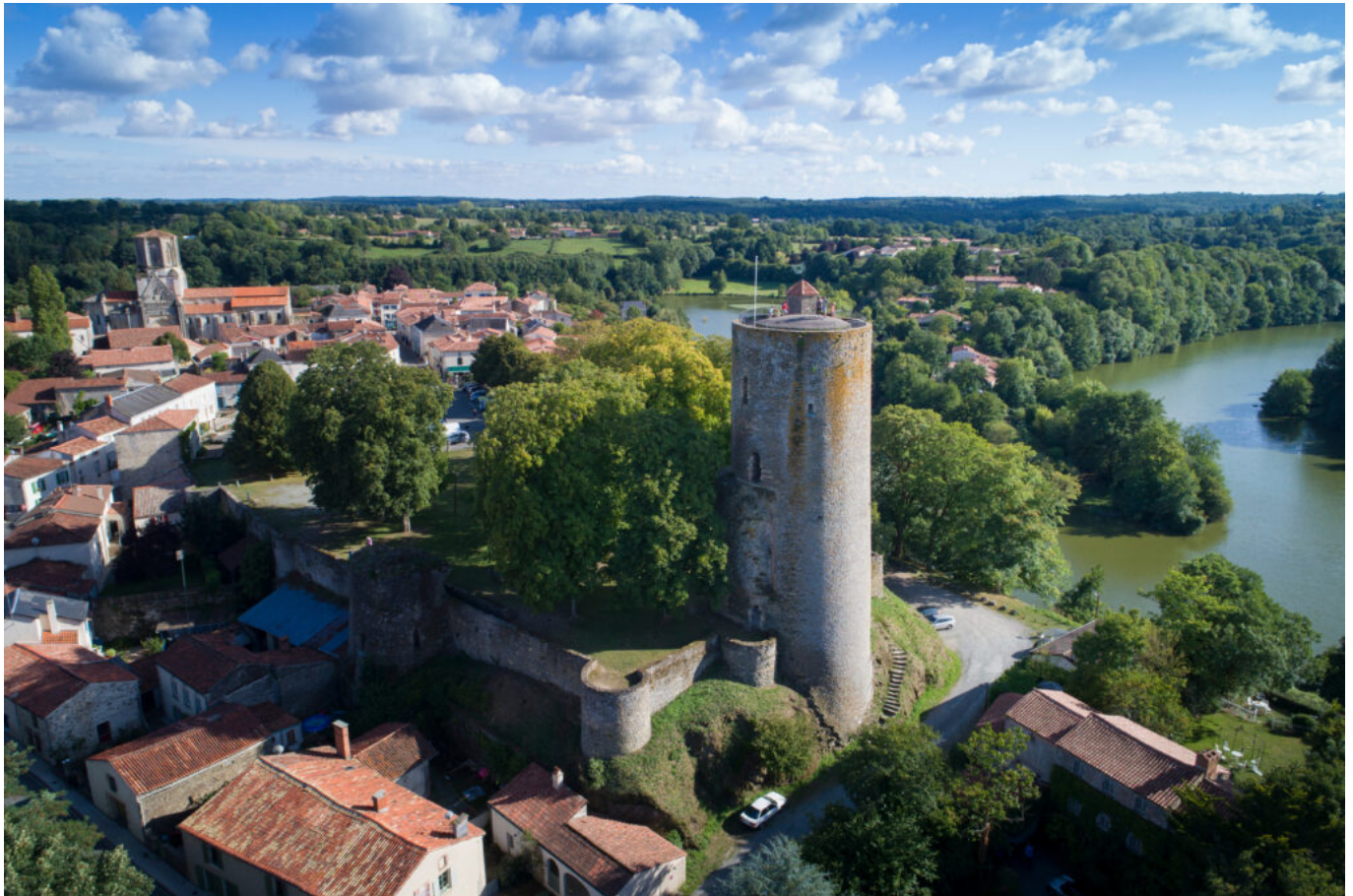
Vouvant, Fontenay-le-comte, Vendée

En savoir plus : Fontenay-vendee-tourisme.com