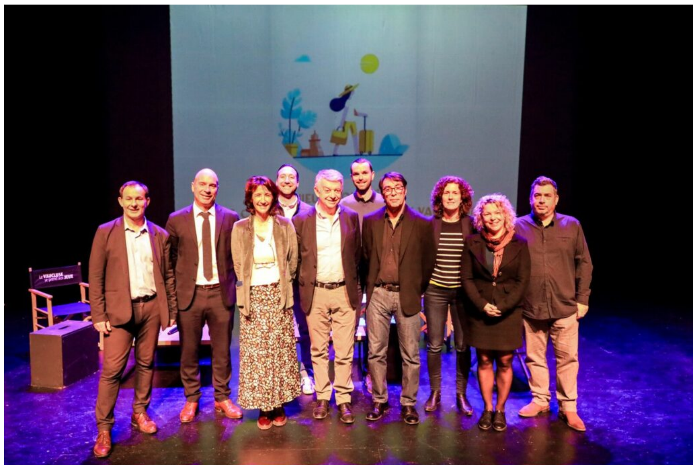
HOCQUEL A - VPA

Le 12 mars dernier, l'agence du développement, du tourisme et des territoires Vaucluse Provence Attractivité a réuni ses partenaires du monde du tourisme à l'Auditorium Jean-Moulin du Thor lors d'un rendez-vous appelé « Mieux connaître les clientèles touristiques en Vaucluse. »