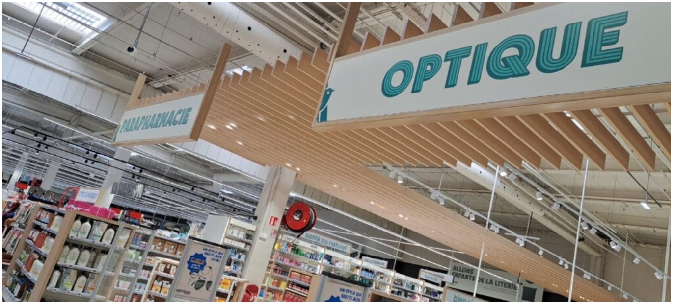
Deux nouveautés : les rayons optique et santé.

d'électro-ménager, mais davantage d'alimentation. Deux nouveaux services aussi, Santé et surtout Optique avec une professionnelle diplômée et référencée par la CPAM (Caisse Primaire d'Assurance Maladie) et les mutuelles ainsi qu'une cabine de tests visuels. La qualité y est puisque nous proposons une large gamme de lunettes Essilor (société française qui a inventé le 1 er verre progressif) moins chères qu'ailleurs. »