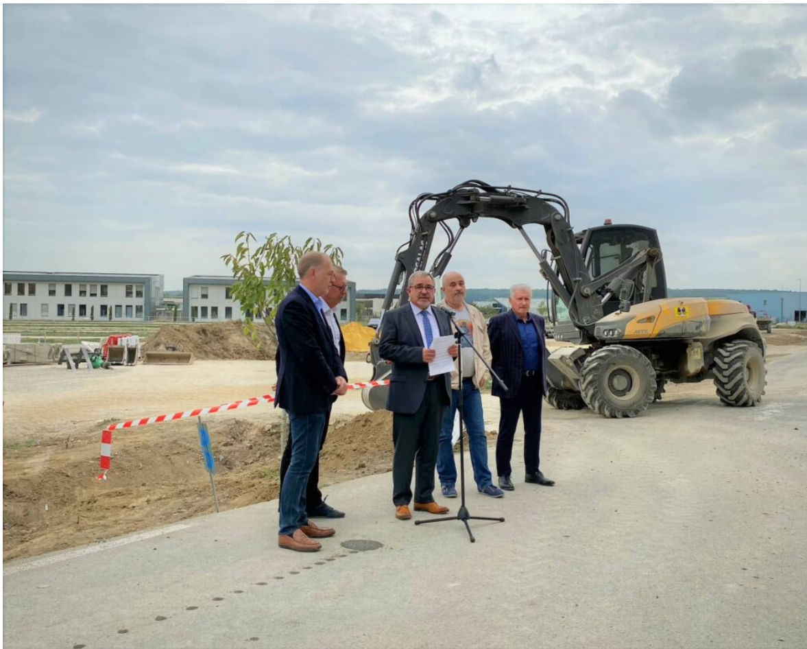
Les élus du Grand Avignon lors du lancement des travaux le jeudi 20 octobre.

Les parkings-relais des Italiens, Amandier, Piot et Courtine compte à eux tous 3 350 places et desservent 8 lignes de bus. A ceux-ci devraient s'ajouter le parking-relais Saint-Chamand, dont l'ouverture est prévue en février 2023 et qui comptabilisera 365 places, ainsi que celui d'Agroparc, qui lui devrait être accessible à tous en mai 2023 et comptera 320 places. Viendront ensuite ceux des Angles, de Rognonas et de Réalpanier. Pour ces cinq nouveaux parkings-relais, le Grand Avignon a dû investir un budget total de 24 millions d'euros, dont 1,93 millions sont réservés à celui d'Agroparc.