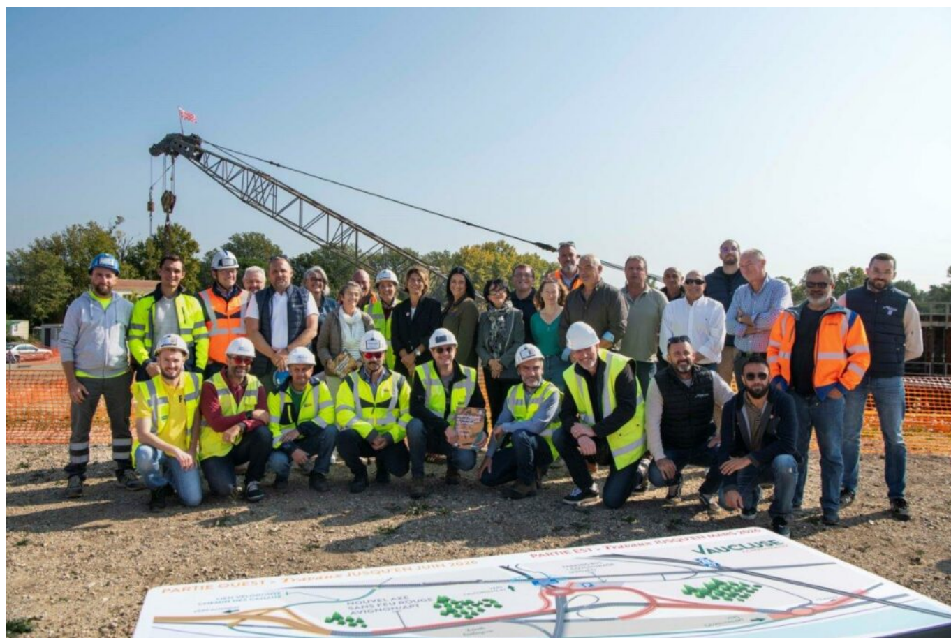
Une visite du chantier a été organisée ce mercredi 14 octobre.

Ce nouveau giratoire devrait être mis en service à la fin de l'année et des modifications de circulation seront aussi mises en place au travers de deux voies provisoires à la sortie de l'autoroute vers les Bouches-du-Rhône et à la sortie de l'autoroute vers Avignon. Tous les accès au péage d'Avignon Sud se feront à partir du nouveau carrefour giratoire.