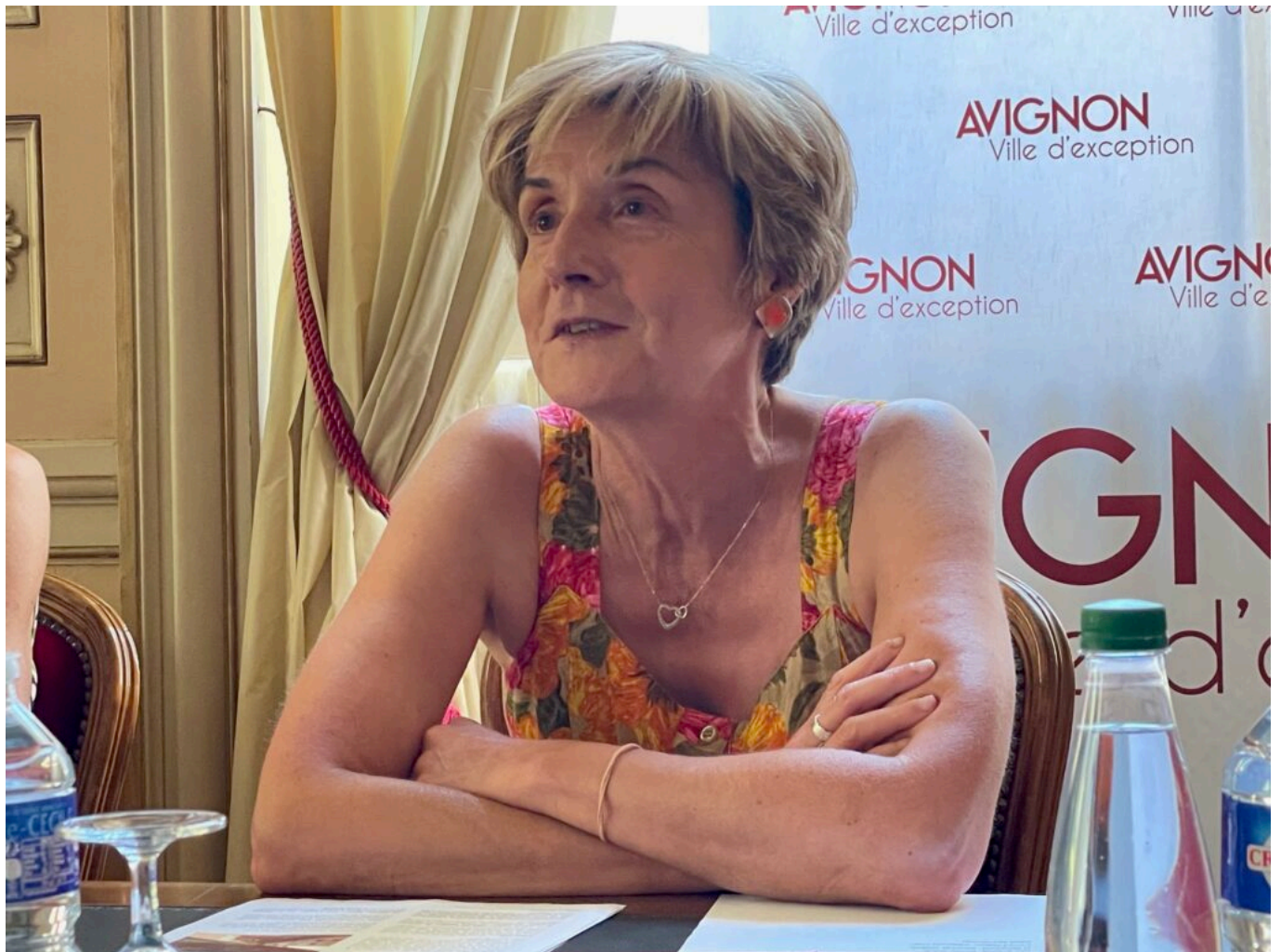
Cécile Helle, maire d'Avignon

'A l'image des requalifications urbaines, menées depuis 2014, de la nouvelle vie de la Cour des Doms -dont le quartier des femmes est actuellement en travaux et abritera notamment la friche artistique-, demain celle des Bains Pommer, des grands chantiers de rénovation d'équipements publics, comme le stade nautique ou actuellement la bibliothèque Renault-Barrault, la Ville s'engage sur des préservations et la mise en valeur du patrimoine, tout en participant à l'attractivité de la ville et à la qualité de vie de ses habitants. Le Groupe è-Hôtels acquiert l'Hôtel des Monnaies et l'Hôtel Niel pour la somme de 2,3M€ pour une surface plancher totale de 1 770m 2 .'