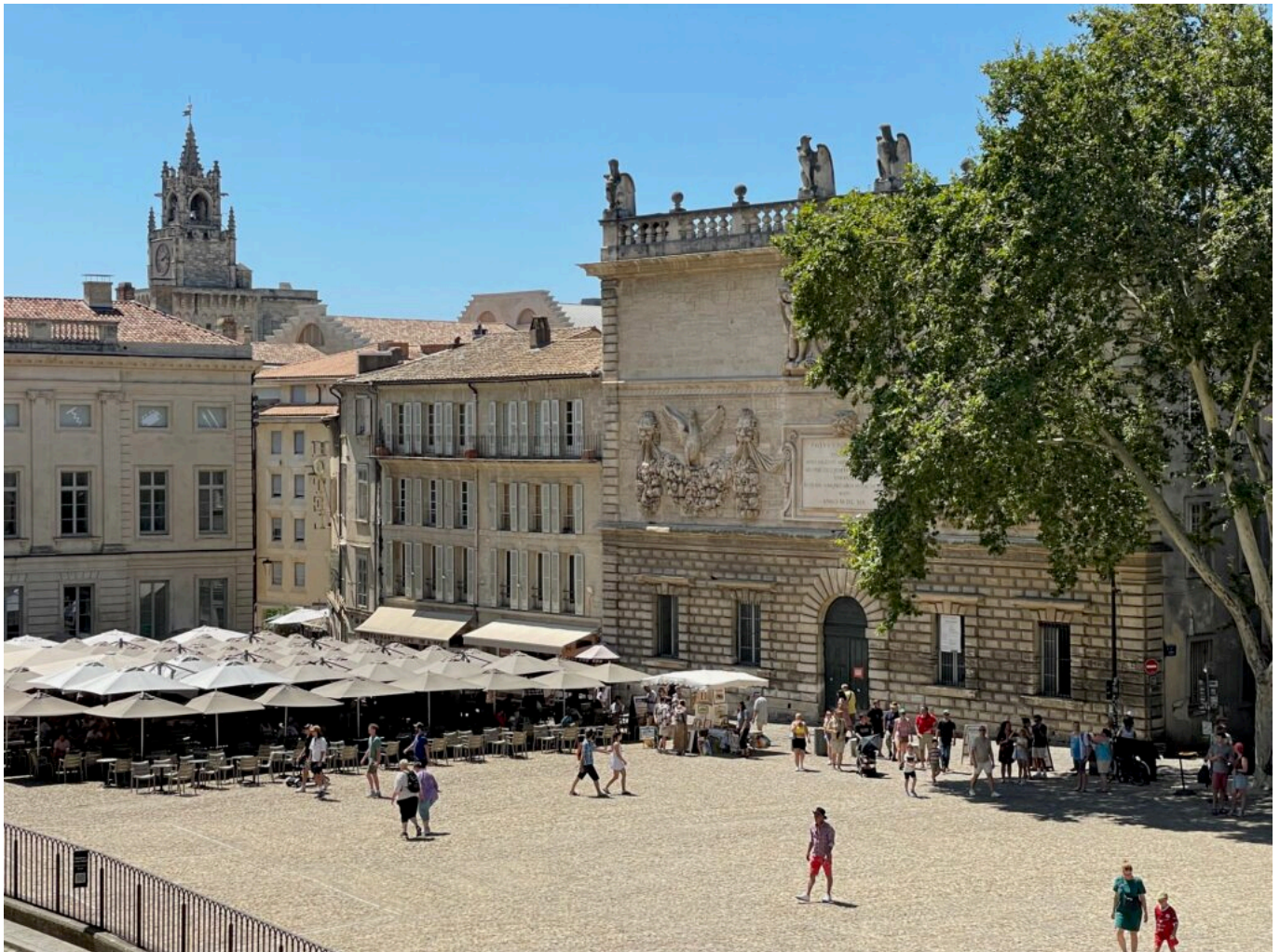
Hôtel Niel et Hôtel des Monnaies, place du palais des papes