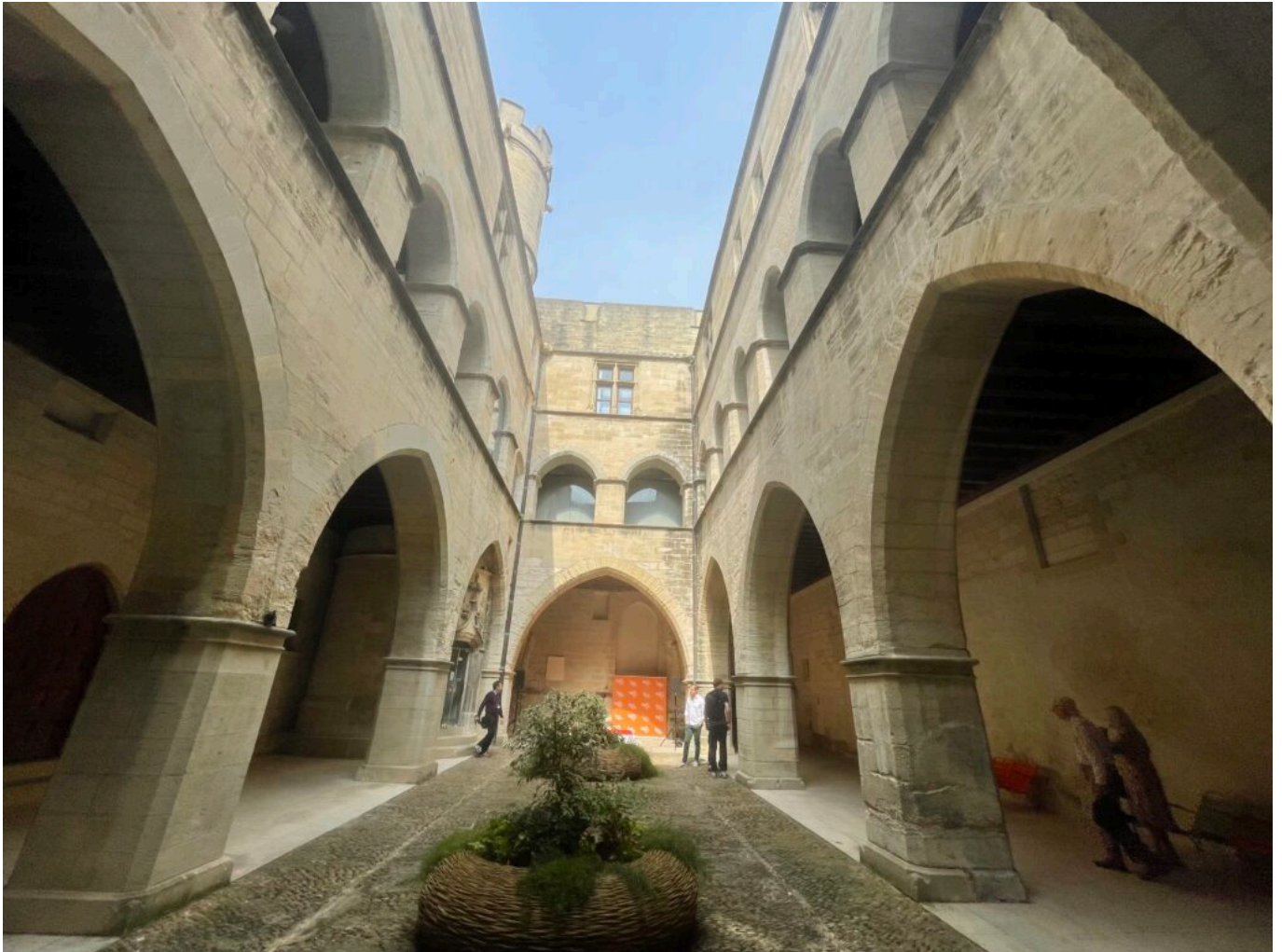
Cour intérieure du Petit palais