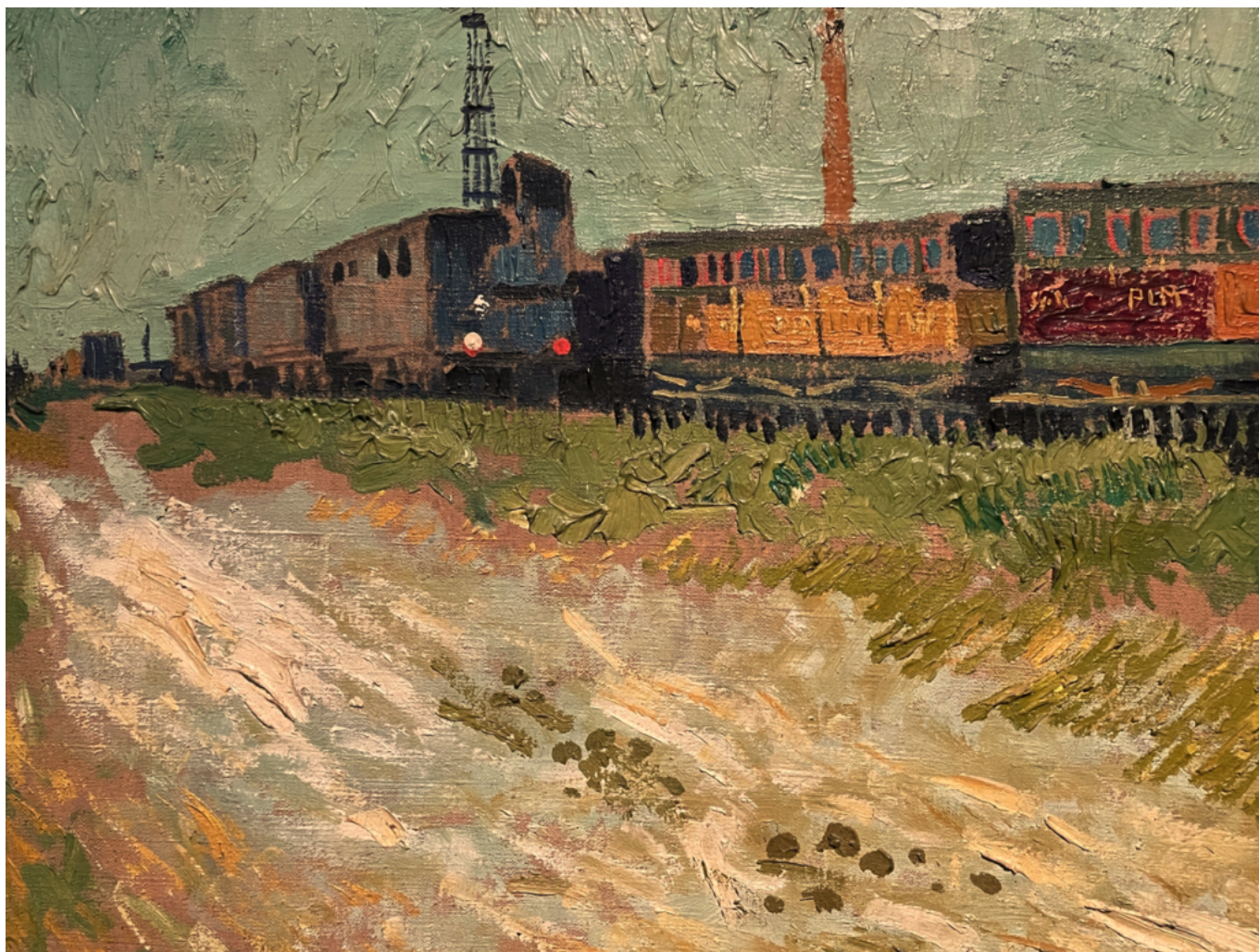
Wagons de chemin de fer à Arles de Vincent Van Gogh en 1888

Conséquence directe : pas d'exposition d'été 'classique' en 2026, afin de concentrer l'énergie de l'équipe sur la réécriture du projet muséal à l'horizon 2030. Pour autant, le musée refuse l'hibernation culturelle et mise sur des formats plus vifs, plus proches, plus sensoriels.