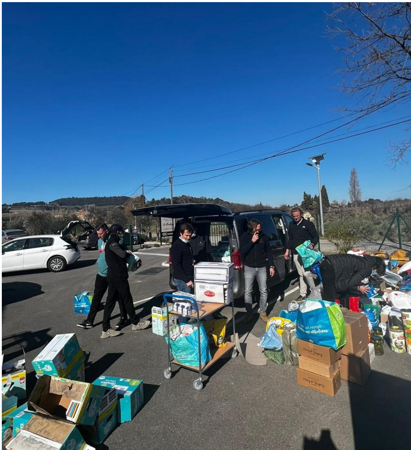
Les cartons s'accumulent.