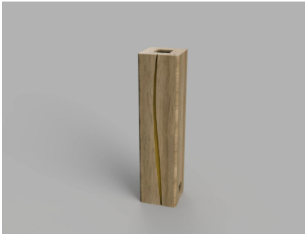
Un totem en chêne massif digne des meilleures décorations mondaines

exemple de désinfecter 3 fois l'air par heure en présence humaine pour une pièce de 25m2.