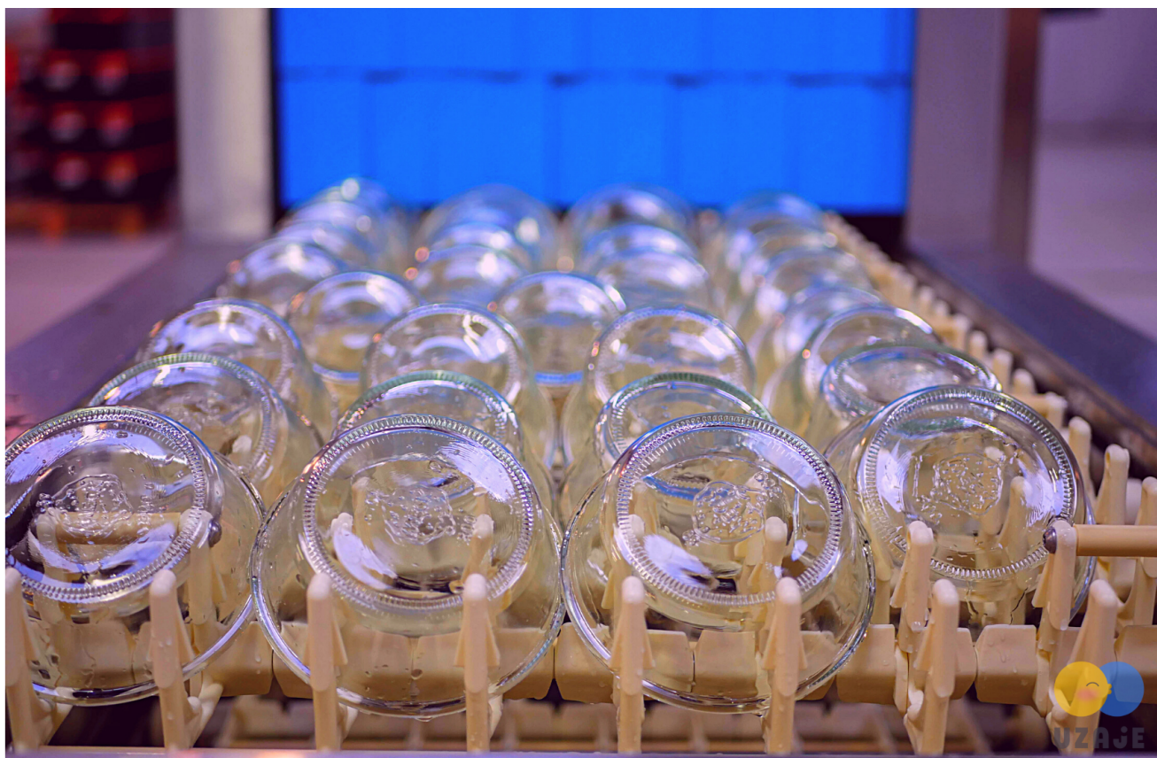
Contenants Uzaje restauration commerciale.