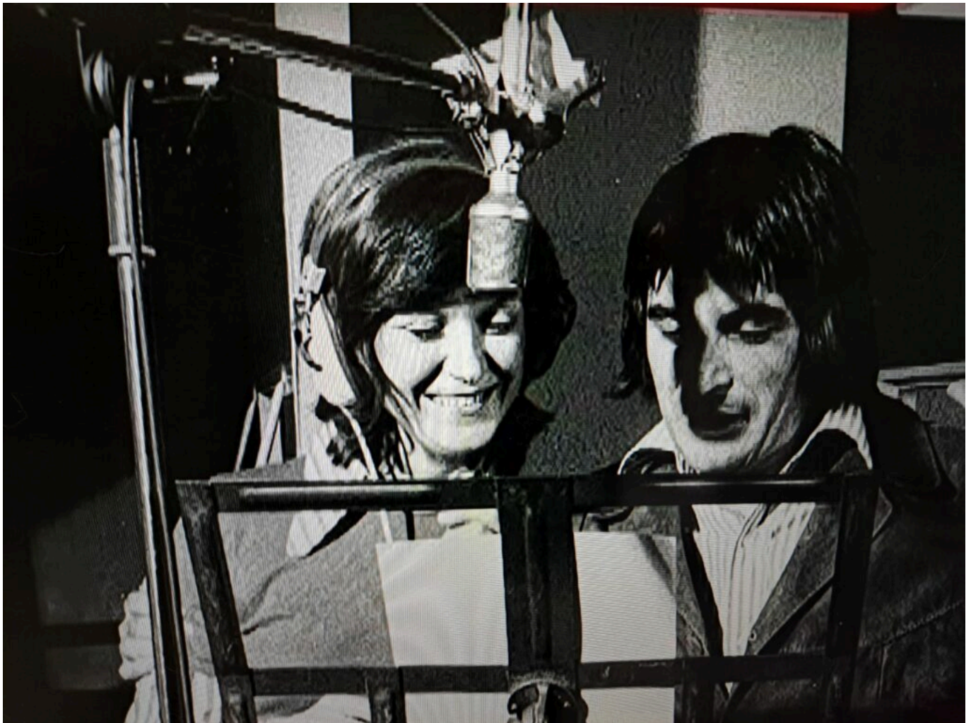
En Studio avec Serge Lama.