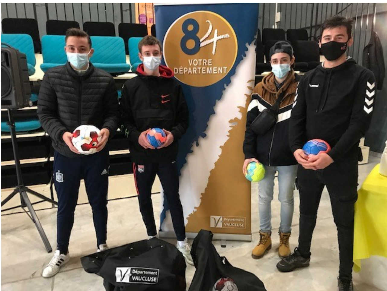
Remise de 418 ballons au Centre départemental de plein air et de loisirs à Rasteau.

Le 18 février à l'espace Pierre Petit à Jonquières : clubs du Canton d'Orange (Caderousse, Orange, Piolenc), Canton de Sorgues (Bédarrides, Courthézon, Jonquières, Sorgues).