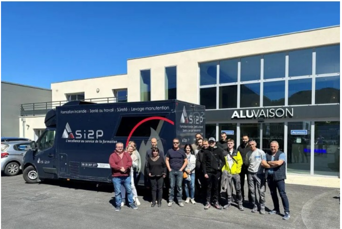
Alu Vaison

«Puis nous sommes passés de 8 à 19 salariés et de 1,5M€ à plus de 4M€ en 2024. Nous avons construit une nouvelle usine de fabrication, puis nous avons été frappés de plein fouet par la pandémie de Covid 19 le 17 mars 2020. Les premières et dernières nuits ont été difficiles parce qu'on ne savait pas où l'on allait. Mais avec le recul, la crise du Covid s'est révélée être un bon booster, nous permettant de nous développer, même si nous devons faire face au problème d'approvisionnement et à la pénurie d'acier.»