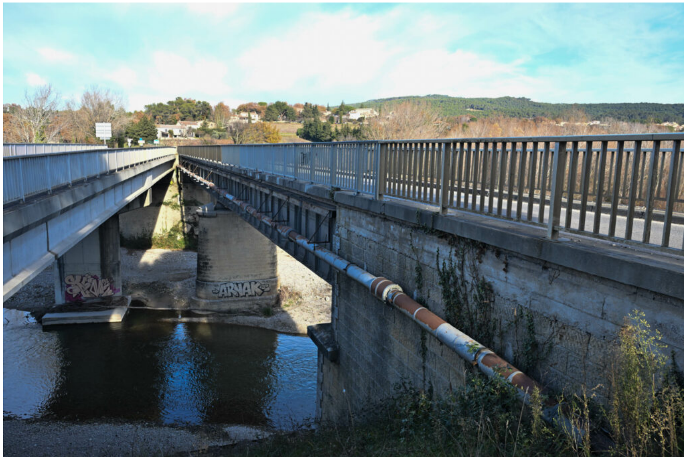
Le pont Valentin (à gauche) et le pont qui va être destiné à la véloroute (à droite).

réservé au garage, à la carrière Vaison Béton, ainsi qu'aux riverains du Chemin du Tarin.