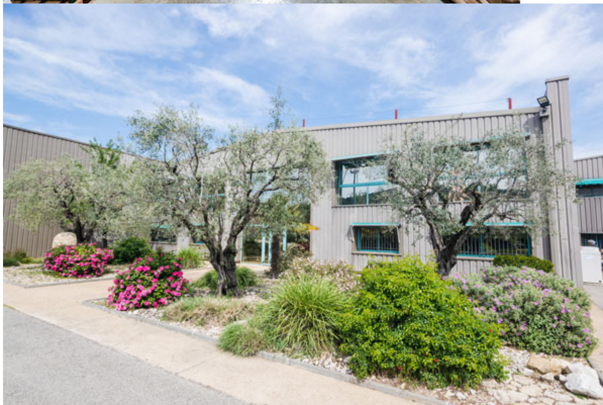
Le site de Vaison.