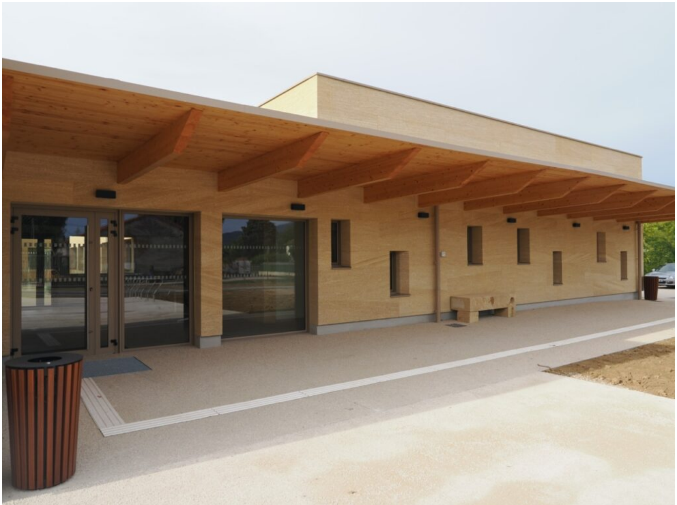
La salle Sandrine Martinet

La salle Sandrine Martinet sera inaugurée le samedi 12 octobre à 18h en présence de la championne paralympique.