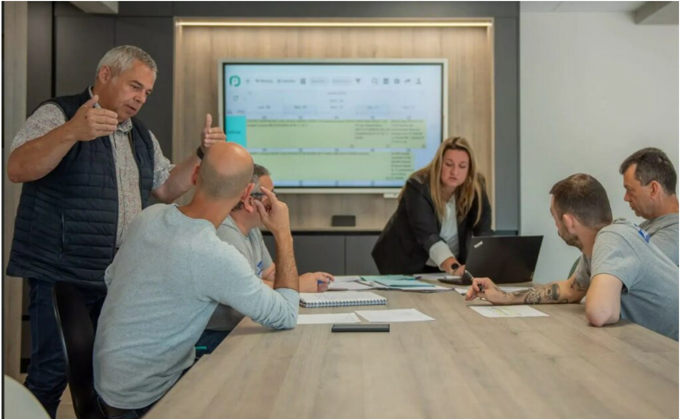
Une des équipes d'Alu Vaison

«Devenu ingénieur, j'ai travaillé dans de grands groupes tels que Bouygues et Vinci. C'est là que j'ai appris mon métier. Puis, alors que je travaillais chez Vinci, un nouveau dirigeant est arrivé. Je n'avais pas envie de rester, même si je n'avais pas tout à fait encore un projet en tête. Nous nous sommes quittés dans de bonnes conditions. Un an plus tard je reprenais, via le C.R.A. délégation d'Avignon, Alu Vaison.»