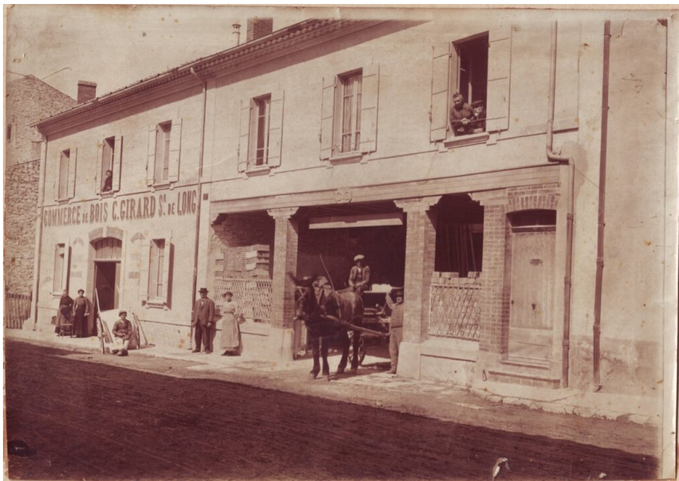
Image d'archives des établissements Benjamin Long.

Cette année, Augier célèbre donc ses 125 ans. Ce sont cinq générations qui se sont succédé et qui ont fait de l'entreprise ce qu'on connaît d'elle aujourd'hui, à savoir une société pluridisciplinaire, qui maîtrise plusieurs métiers : les matériaux, la menuiserie, le carrelage, le sanitaire, la cuisine et le bricolage.