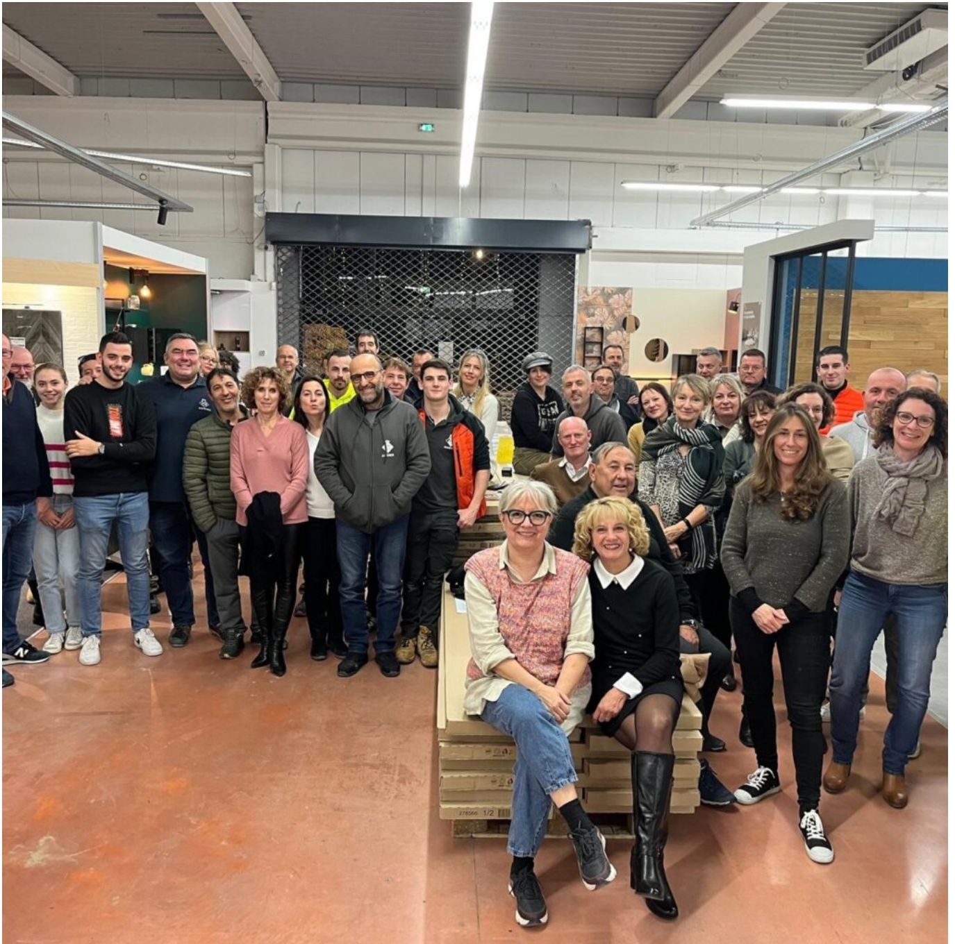
L'équipe Augier.