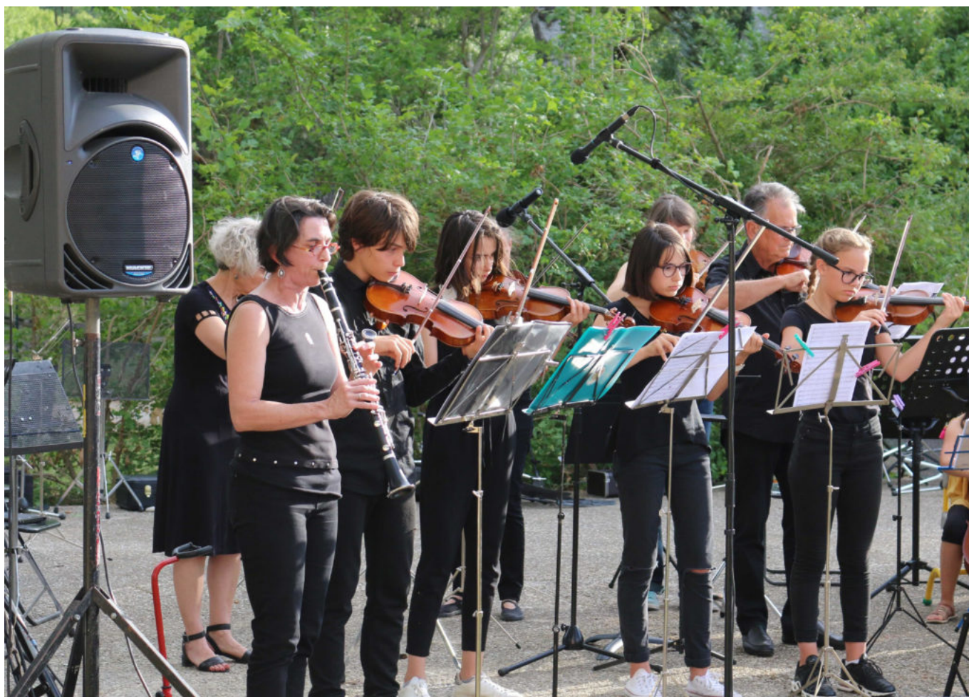
© Ecole de musique et danse Vaison Ventoux

A partir de 7 ans, ils peuvent pratiquer un instrument en cours individuel ou s'initier au chant, en cours particulier ou en chorale. Les adultes ont, quant à eux, toute leur place au sein de l'école de musique, que ce soit pour une pratique confirmée ou débutante. De nombreuses disciplines collectives sont également proposées, pour le plaisir de faire de la musique ou du chant ensemble !