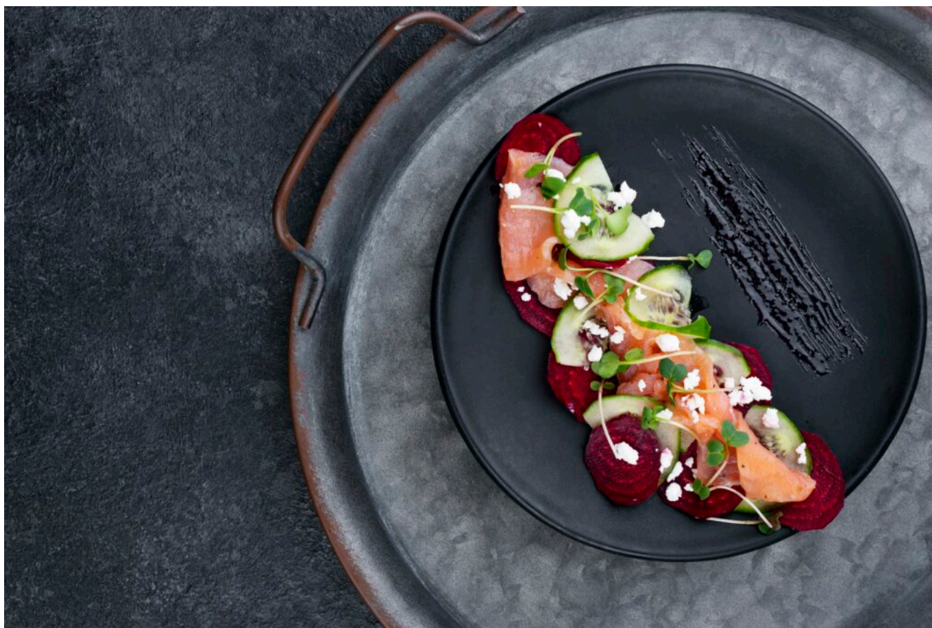
Repas étoilé