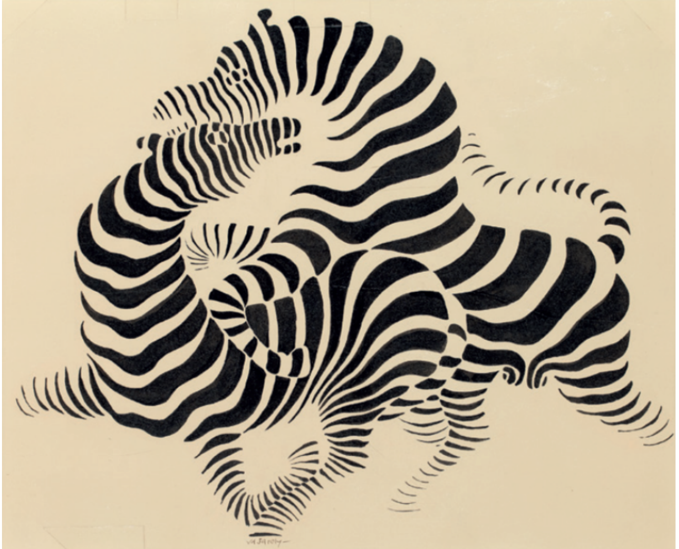
Zèbres A, 1938, Victor Vasarely