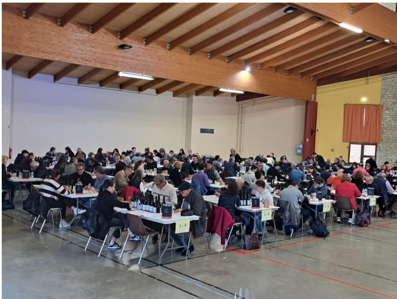
Une partie des jurés.

Contact : concoursvinsparis@vaucluse.chambragri.fr