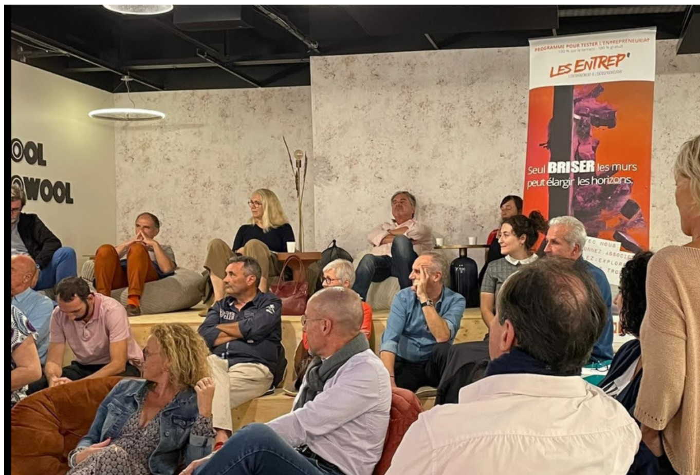
Séance de présentation des projets