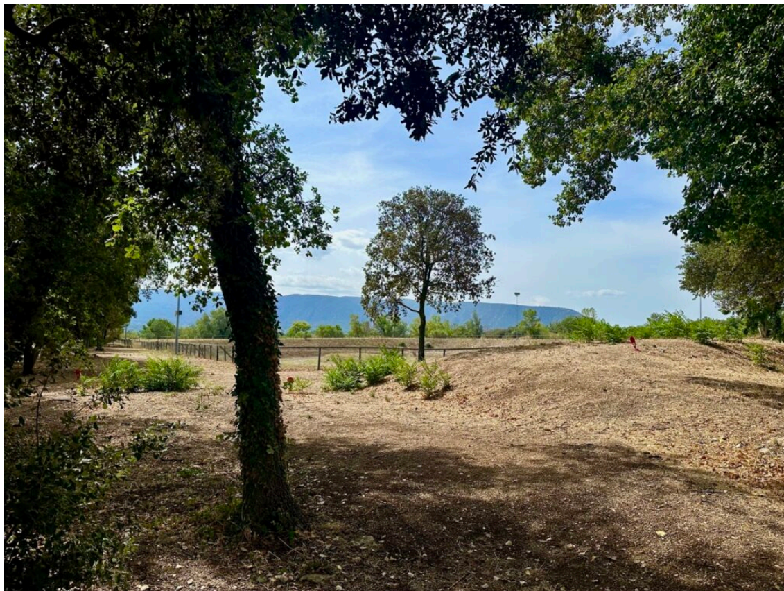
Une partie du site en friche (une ancienne carrière) sur lequel sera installée la centrale photovoltaïque.