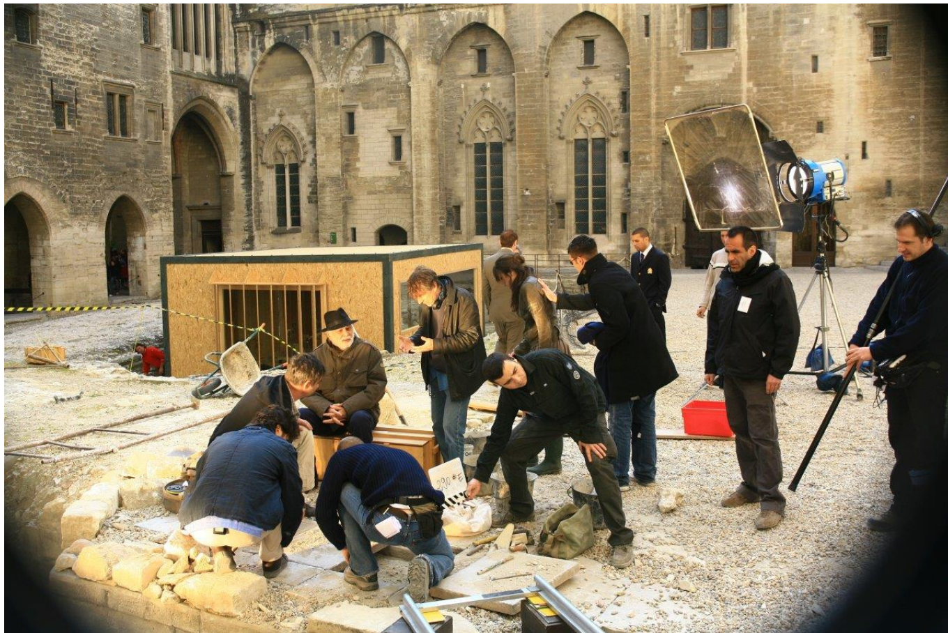
Tournage de la mini-série 'La prophétie d'Avignon'.