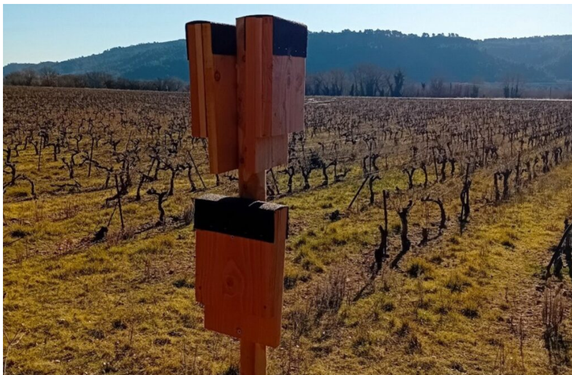
Nichoirs de types fissuricoles sur poteau au sein d'un domaine viticole