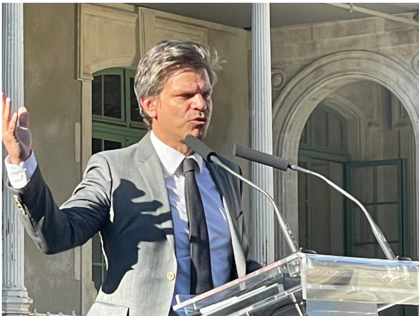
Benoît Delaunay Copyright MMH