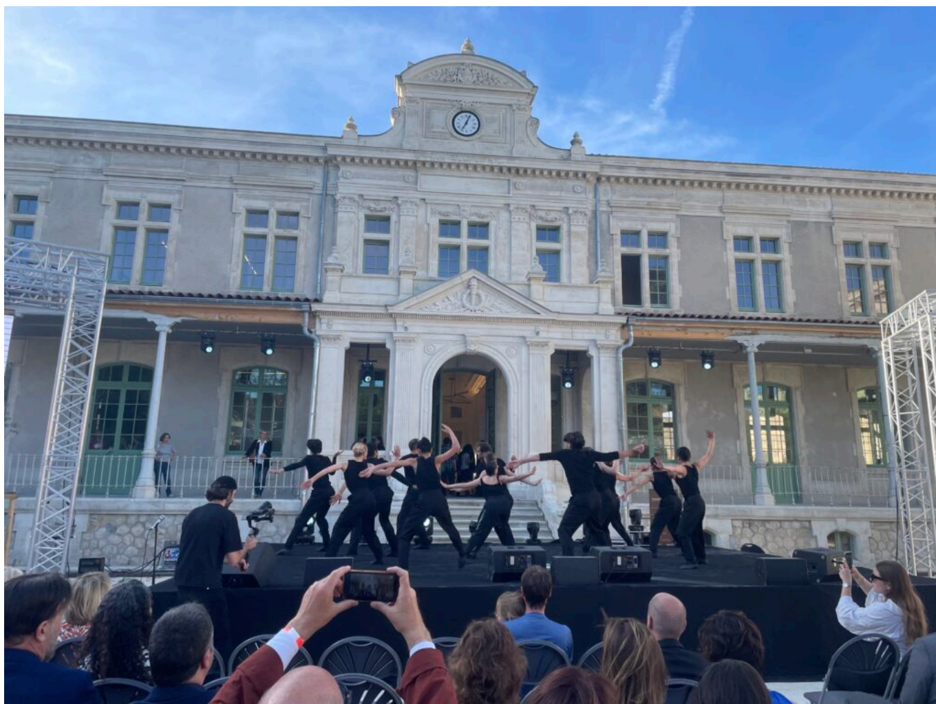
Danseurs de l'Opéra du Grand Avignon