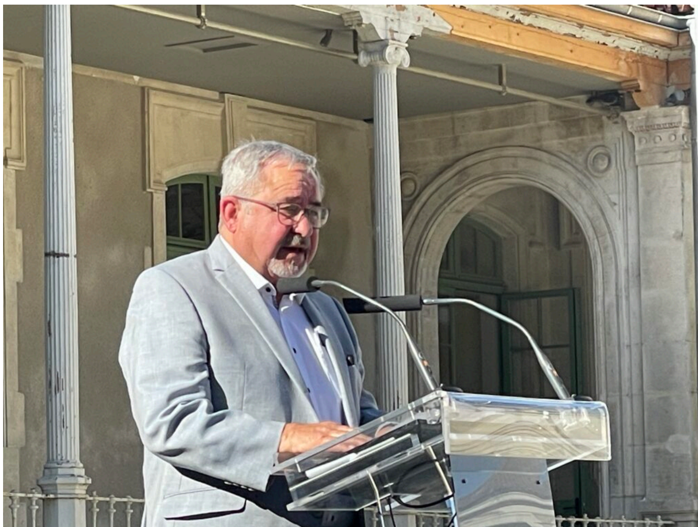
Joël Guin Copyright MMH