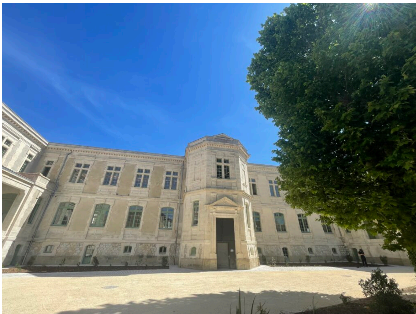
Arrière du bâtiment de la Villa créative