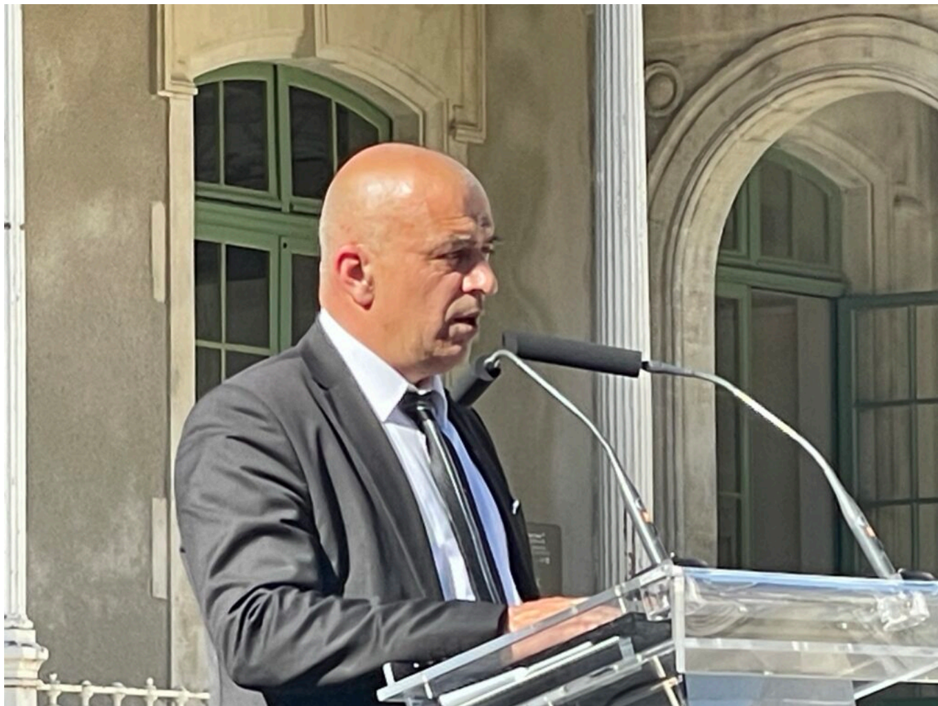
Georges Linarès Copyright MMH