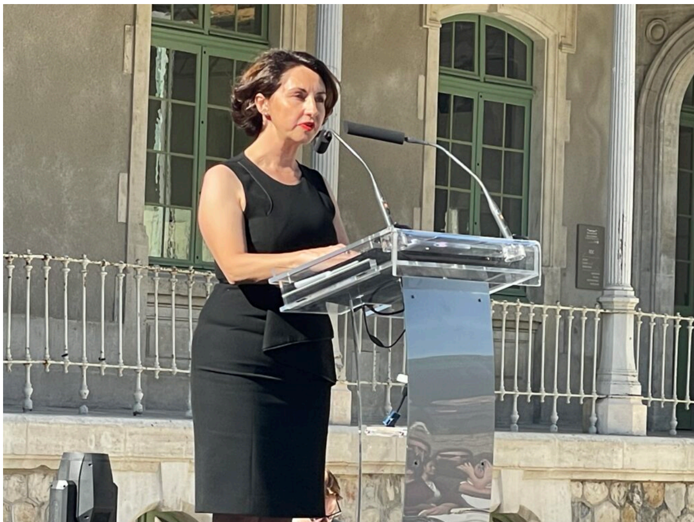
Anne-Lise Rosier Copyright MMH

celui d'une université innovante, entreprenante qui se réinvente pour trouver les moyens de son développement et qui s'engage dans son territoire de façon inédite.»