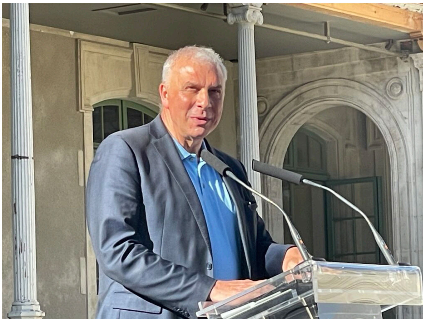
Michel Bissière