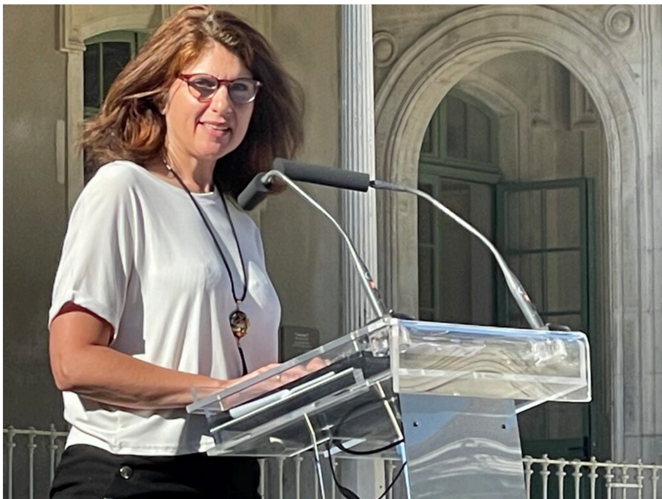
Cécile Galloselva