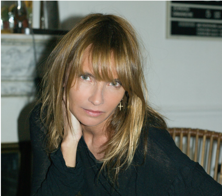
Axelle Laffont