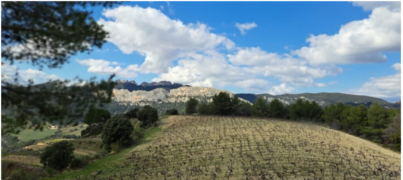
Les Dentelles de Montmirail.

Dentelles qui ont fait leur apparition il y a 5 millions d'années. « Tout cela constitue un sous-sol unique, avec des paysages à couper le souffle, entre oliviers, abricotiers, câpriers, impressionnantes lames grises et pierres sèches des restanques où l'amplitude de la température la nuit est de 6° entre le sud à Aubignan par exemple et le nord à Suzette et des vendanges qui sont décalées de 8 à 15 jours selon les parcelles. »