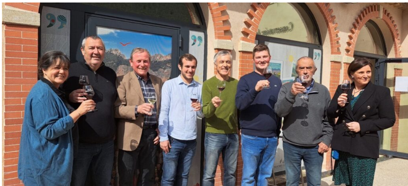
Les organisateurs du centenaire.

guinguette, le 8 août un banquet paysan à Beaumes et le lendemain sur place, bodéga du muscat pour conclure. »